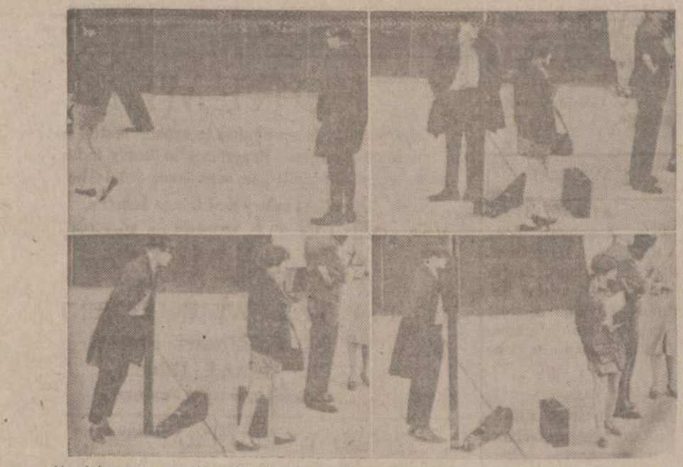
Vyrai jau senų senovėje mėgo žiūrėti į gražias moteris. Dabar, patrumpinus sijaunelius, šis senas paprotys dar labiau paplito. Paveiksle matome Indianapolio jaunuoli, besisukančią pagal sijaunę. Akimis jis fotografavo trumpą sijaunę, nežinodamas, kad kitas meistras jį fotografavo.

BALZEKAS MOTOR SALES "U WILL LIKE US" CHRYSLER • IMPERIAL PLYMOUTH • VALIANT 4030 Archer VI 7-1515