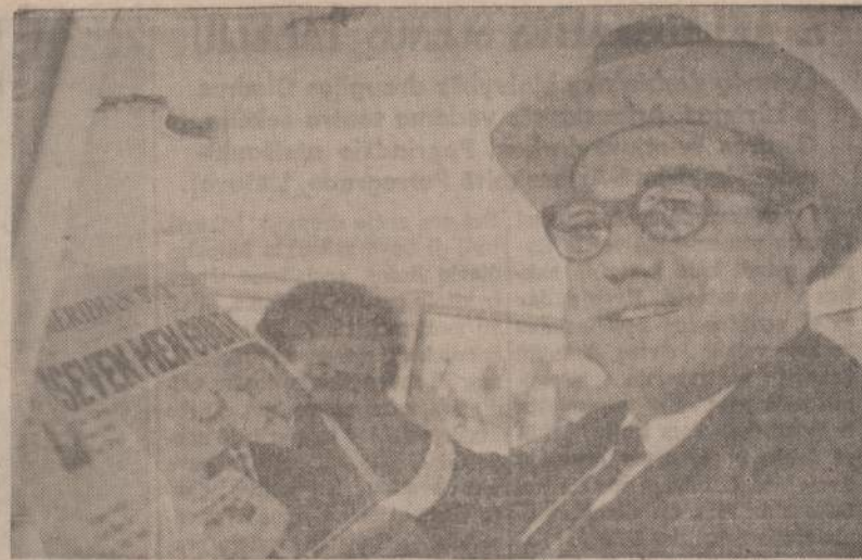
Neshoba apskrities šerifas Lawrence Rainey Meridian, Miss., prisiekusiųjų teismo pripažintas nekaltu, tuo tarpu kiti 7 turės atlikti teismo dėl trijų jaunų vyrų nužudymo.

veiksmus, kad pašalintų Šv. Kazimiero kapinėse dabar įvestą lietuviams nepriimtą tvarką. Buvo leista patiems žmonėms pasisakyti — pasiskųsti. Pradėjus žmonių skundų klausytis, tiesiog šurpas nukrėtė. Nejaugi mes atsidūrime nekultūringiausiame Afrikos kampelyje. Štai lietuvių aukomis nupirktas žemės sklypas — kapinės, kur neleidžiama patiems lietuviams tvarkytis, bet skiriamas vyskupo asmenys, kurie tiesiog tyčiojasi iš lietuvių jausmų. Pasipylus skundams, teko girdėti: Tėvų laidojant žmonai ir vienam vaikui leidžiama į koplyčią įeiti, kitiems nelei-