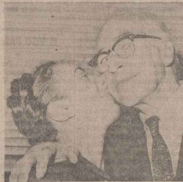
Dr. George Wald, Harvardo Universiteto profesorius, gavo Nobelio premiją už mokslinius akies tyrimėjimus. Jam pavyko nustatyti kaip akies retina padeda perduoti matomą paveikslą. Profesorius žmona sveikina premiją laimėjusį mokslininką.