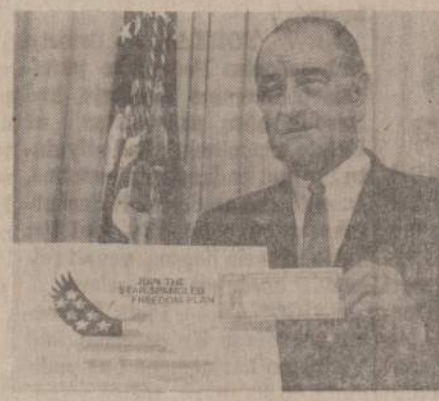
When you buy U.S. Savings Bonds regularly through Payroll Savings where you work or Bond-a-Month where you bank — you are also entitled to purchase new Freedom Shares. Freedom Shares are short-term Savings Notes. They pay a higher return than Savings Bonds (4.75% when held to maturity in 4 1/2 years), may be bought one-for-one with Bonds in your demerit account, and are redeemable after one year — you will find complete instructions where you work or bank. President Johnson displays the first Freedom Share.

"Freedom must be at all times defended, because it is at all times besieged. Not all of us are called to fight on the battlefield. Many of us must, quietly and firmly, do what we can and all that we must, here at home. Buying Bonds, regularly, is as important to this nation in the long reach of history as almost anything we can do."