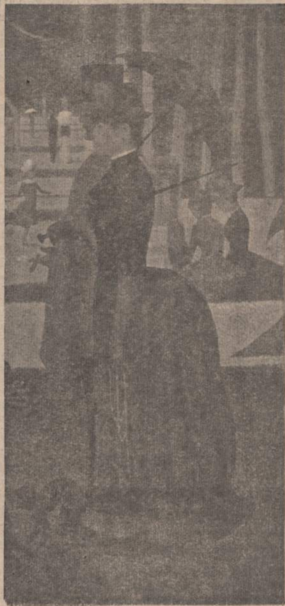
Georges Seurat "La Grande Jatte" (Chicagos Art Instituto nuosavybė)