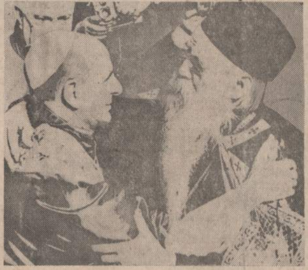
Popežius Paulius VI ir Konstantinopolio patriarchas Atenagoras sveikinasi Romoje, prie Šv. Petro bazilikos vartų. Jiedu nori baigti 9 šimtmečius besifokusį skilimą tarp Romos katalikų ir stačiatikių. Jiems atrodo, kad nesutarimams nebūvo didelio pagrindo.

Perna Dow Chemical pagamins per metus 54,620 tonų napalmo. Jis jau buvo naudojamas ir Korėjoje kare. Tada iš viso napalmo buvo suvartota 32,215 tonos.