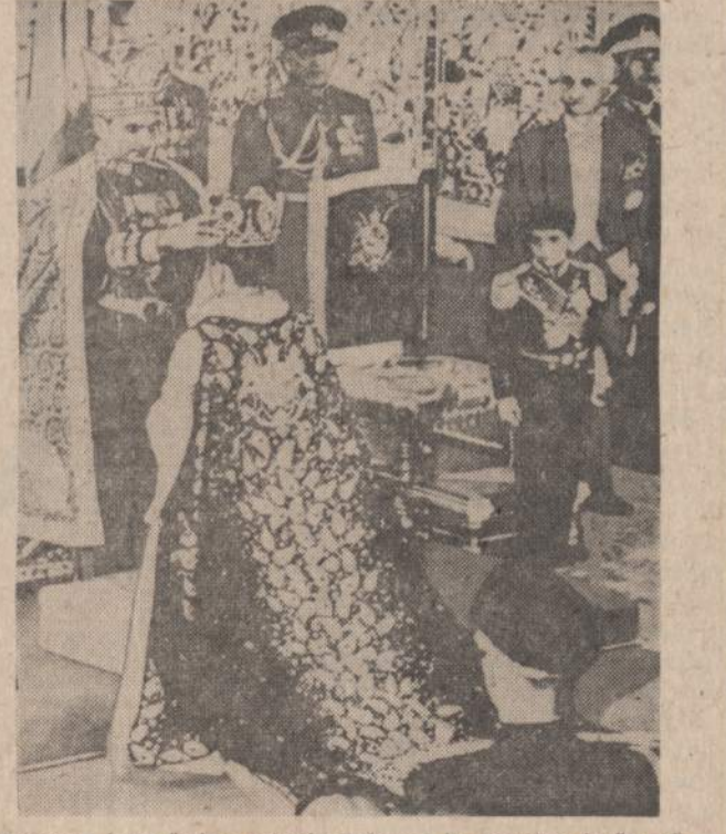
Teherane, Irano šachas, pravedęs reformas ir apraminęs kraštą, užsidėjo imperatoriūso karūną. Paveiksli matome, kaip jis imperatoriūso karūną deda ant savo žmonos galvos. Karūnavima stebi jų sūnus Reza.

Sekmdienį pasibaigia dienos šviesos taupymo laikas. Sekmdienį, antrą valandą naktį visi privalome pasukti laikrodžius vieną valandą ATGAL.