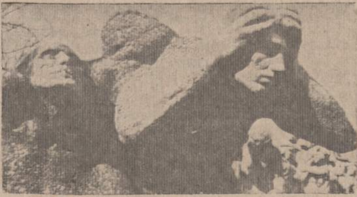
Iš Lorado Tafto skulptūros "Laiko Fontanas" Washingtono Parke Chicagoje