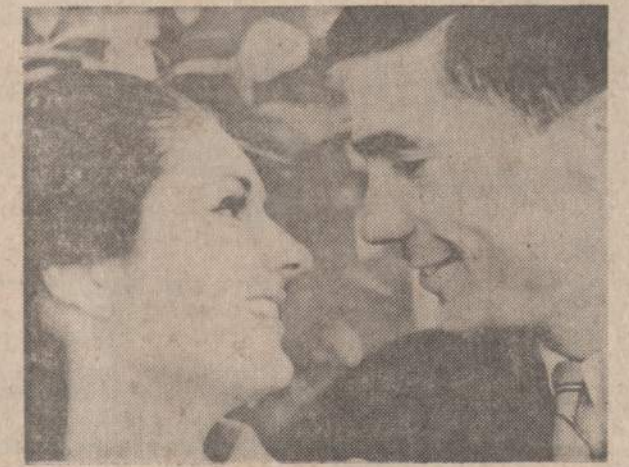
Prezidento duktė Lynda Bird Johnson ir jos sužadėtinis marinų kapitonas Charles Robb.

BERLYNAS. — Jaunas, 25 metų vyras pabėgo iš Rytų Vokietijos į vakarus, perplaukdamas pasienio ežerą į šiaurę nuo Cerlyno.