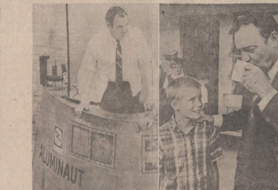
Floridos gubernatorių Claude Kirk lipa į nardlaivį, kuriuo leisīs į jūros dugną, kad galėtų nustatyti Floridos valstijos sienas jūros pakraštyje. Biznieriiai ten rengiasi siekti žibalo. Dešinėje tas pats gubernatorių, išgėres puodelį citrinos sunkos, liepė jaunam vyrui gauti reikalingus leidimus sunkai pardavinėti. Liepė ir svaros prisilaikyti.

Sitokie junginiai paradai įvyko dar Dresdene, Magdenburge ir Erfurte. Parada per televiziją buvo parodyti ir kitiems komunistiniams kraštams.