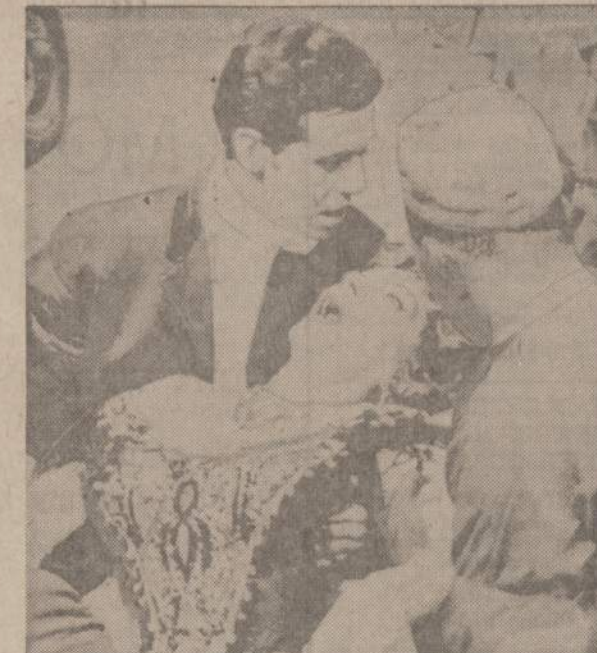
Artistė Martha Raye, vaidinama Vietname kovojantiems kariams, scenoje neteko sąmonės ir suknubio. Tvirtinama, kad karštas ir drėgnas klimatas paveikęs jos žirdį.