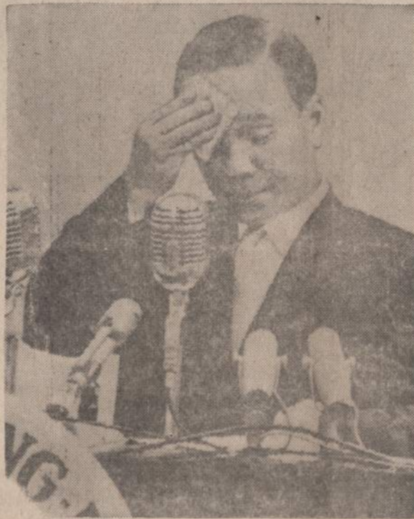
Gen. Van Thieu, prisaiškintas Vietnamo prezidento pareigoms, nušluostė prakaitą ir naujai išrinktam parlamentui paskelbė, kad paleista 10 generolų komisija, du metus valdžiusi kraštą, pravedusi rinkimus ir krašto valdymą perdavusi krašto gyventojų rinkimams atstovams.

Partija įsakė agitatoriams miestuose organizuoti politinę veiklą gyvenamuose rajonuose. Ukrainos Zaporoznėj įsteigiama 200 „agitacijos punktų“, kur 600 agitatorių trukdys žmonėms išlėsti ir džiaugtis laisva diena.