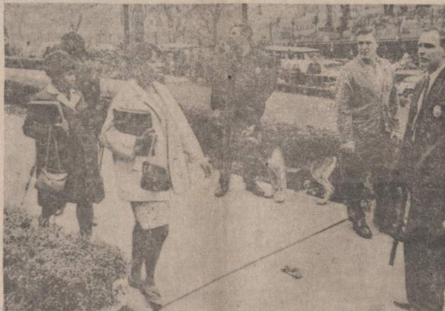
Vienoje Pittsburgho mokykloje negrai studentai pešasi su baltaisiais. Ne vien mokyklos kieme, bet ir koridoriuose stovi policija, pasiruošusi atskirti susipėsius mokinius. Policija atsiveda ir pora šunų neramiesiems suvaldyti.

Alžiro spauda rašo, kad Kongas yra tapęs neo-kolonialistine valstybe. Konge dirba nemažai Izraelio technikų ir žydai net treniuoja Kongo kariuomenės dalinius. Alžiras pasiūlė Kongui atiduoti Tshombę, kuris už akių Kongo teismo yra nuteistas mirti, jei Kongas nutrauks santykius su Izraeliu ir atsitolins nuo Amerikos įtakos. Kongui tai padaryti atsisiakius, Alžiras nutarė Tshombės neatiduoti.