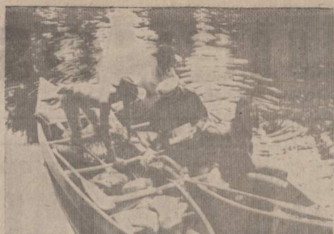
Rengiamės iškylaui, išplaukti iš uosto esančio Canoe lake. Iškyla canoe (kanu) laiveliais įvyko 1967. IX. 2-4 dienomis, Kanadoje.

jimo sistema, pagrįsta didžiuo laisve, veik anarchinio principu. Skaitytoje bauginančiai didelius jaunimo nusikaltimo davinius ir šurpius įvykius... Iš kitos pusės: žinom psichologinė tiesa, kad kiekvienas žmogus — vaikas yra atskiras dvasinis pasaulis; skirtingų polėkių ir reikalavimų. Žymantų dainuojančios šeimos siekima tenka priimti neeiliniu įvykiu. Tai kažkas kviečia staptelėti ties šios šeimos dvasiniu pasauliu ir mesinti žvilgsnį į jo vidų, tikslu pasieškoti dvasinės stiprybės ir pedoginio meno.