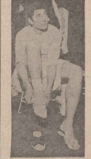
New Yorko sportininkas Joe Namatz buvo sužeistas, bet jis vis dėlto tikisi žaisti prieš Kansas City žaidėjų grupę.