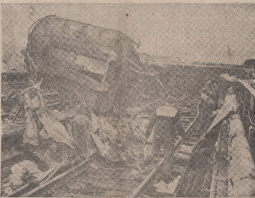
Praeitą šeštadienį į Londoną skubėjęs traukinys nukrito nuo bėgių, užmušė 54 asmenis ir daugelį sužeidė. Pradžioje manė, kad būta sabotažo, bet nustatyta, kad vienas bėgis buvo trūkęs.

Kas turi būti pašauktas ir kam tarnyba turi būti atidėta, paliekama spręsti vietinėms komisijoms.