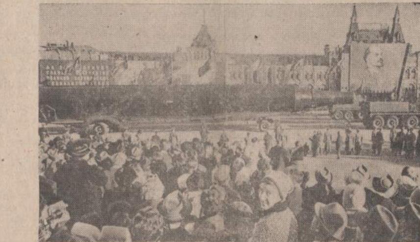
Sovietų karo vadovybė lapkričio 7 dieną atliko Kremliaus aikštėn 120 pėdų ilgio raketa. Rusai tvirtina, kad ji gali paleisti sovini į J. Amerikos valstybes.

Daugelis ministrų nėra politikai, bet administratoriai. Galimas daiktas, kad prezidentas Thieu kabinetą neužilgo vėl reformuos, kai jis pats daugiau įsivirtins valdžioje.