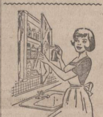
Savo namine vaistų spintelę reikia nepaprastai švariai ir tvarkingai užlaikyti, kaip siame vaizdelyje parodyta: išimti visas butelėles ir išmėgauti lentynas; patikrinti visus užrašus, kad nevyktų klaidų, nes vaistų suvalgymas gali būti fatališkas. Patikrinti, kokiu vaistų trūksta ir juos papildyti kad būtų bet kokiam netikėtumui pasiruošęs.

★ Šių metų lapkričio 6 d. ne dėl redaktorės kaltės straipsnis “Vienos šeimos ansamblis” pateko į “Lietuvių Jūrų Skautijos žinias”. Minėtas rašinys turėjo pasirodyti kitame dienraščio puslapyje, bet pateko Jūros Skautų įžanginiu.