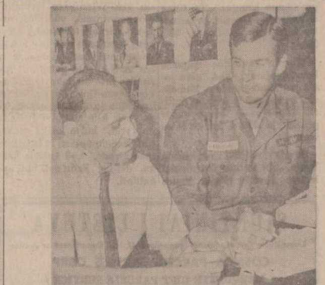
Pagarbės beisbolininkas Jim Lonborg (dešinė) Bostono armijos bazėj.

"NAUJIENOS" KIEKVIENO DARBO ŽMOGAUS DRAUGAS IR BIČIULIS