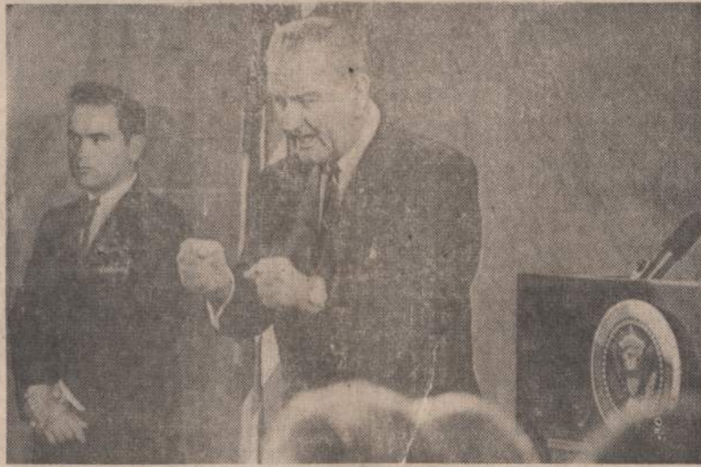
Prezidentas Johnsonas kalba spaudoje konferencijoje.

BELGRADAS. — Jugoslavijos autobusas nelaimėje žuvo 20 asmenų ir 7 buvo sužeisti.