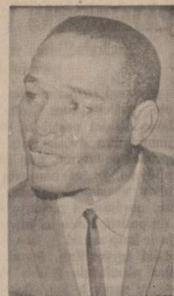
Kovo 22 dieną New Yorko sunkaus svorio čempionas Cassius Clay persilims su paveiksle matomu 34 metų amžiaus boksininku Zora Folley.

Verslininkų tarpe esama tokių, kurie savo verslo apyvartą daro išimtinai su lietuviomis. Ar nereikėtų tiems mūsų tautiečiams "geradariams" priminti ir kartu juos įpareigoti skirti atitinka-