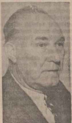
Red Ruffing, sulaukęs 62 metų amžiaus, paskirtas į gerų beisbolininkų Garbės Sąj. Savo laiku jis buvo labai geras žaidėjas.