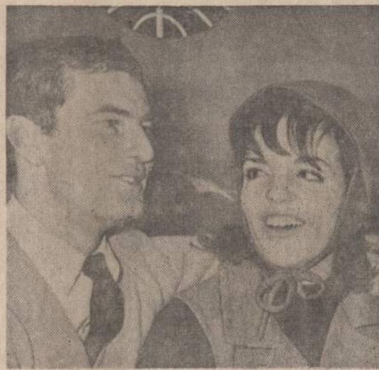
Liza Minelli, dainininkė Judy Garland dukte, nutarė ištėkėti už Australijos dainininko Peter Allen. Jis 23 metų, o ji 20. Abu dainuoja televizijos vaidinimuose.