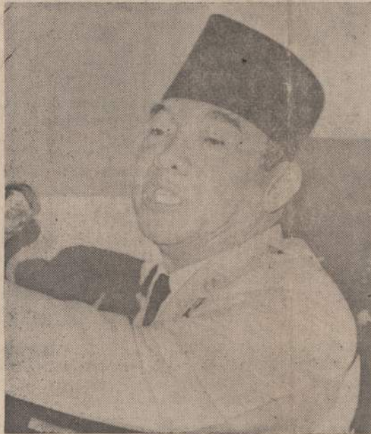
Indonezijos prezidentas Sukarno, 20 metų autokratiškai valdęs visą kraštą, buvo priverstas atsistatydinti. Už pritarimą komunistų perversmui, kariai priverstė Sukarno atsakyti nuo savo teisiu. Atrodo, kad Indonezijos parlamentas ruošia jam teismą. Prezidento pareigas perėmė gen. Suharto.

Naujų Metų kalboje Chiang Kai Šekas pareiškė, kad Mao jau įkerito į duobę, kurią jis pats išsikasė. Bėliką pagalvoti, kaip surinkti jo suskaldytos Kinijos dalis.