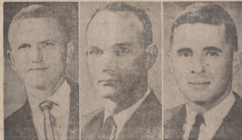
Antrąją Saturno raketos įgulą sudaro astronautai (iš kairės į dešinę) Frank Borman, Michael Collins (vidury) ir naujokas William Anders. Jeigu pirmoji įgula dėl kurių nors priežasčių negalėtų pakilti, tai šiam žygiui ruošiasi antrąji įgula. Astronautai rengiasi Saturno raketa pakilti į erdvę ateinančių metų pabaigoje.

◆ Po 16 mėnesių vedybų Frank Sinatra ir Mia Farrow nutarė atsiskirti.