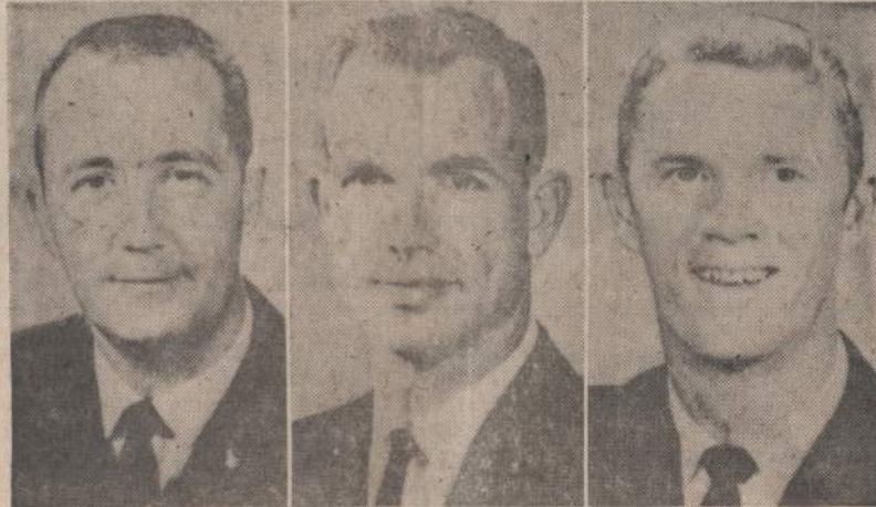
Astrontas James McDivitt (kairėje) vadovaus trijų vyrų įgulai, kuri ateinančių metų pabaigoje galingo Saturno raketa pakils į erdvę ir paleis menulio kryptimi erdvėlaivį. Kartu su juo skris padangėmis vidury matomas žinomas astronautas David Scott ir naujokas R. Schweikart.

kių naujų argumentų bolševikiški sistemai apginti straipsniuose nėra pateikta. Vienintelė naujiena skaitytojams yra nebent dalinis atpasakojimas, ką apie bolševizmo nuopelnus samprotauja amerikiečių ekonomistai laikrašči.