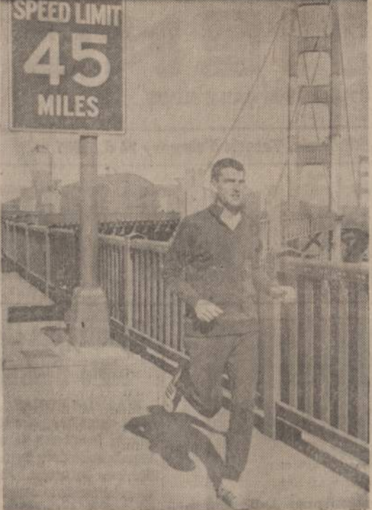
Australijos bėgikas Ron Clarke šią savaitę dalyvaus San Francisco mieste vykstančiose lenktynėse. Jis bėga išgarsėjusiu Aukšiniu tiltu, kad būtų pasiruošęs lenktynėms.

registruojasi: vyrų ir jaunių A klasės ne daugiau po 8 komandas, vyrų klasėse ne daugiau po 6 komandas.