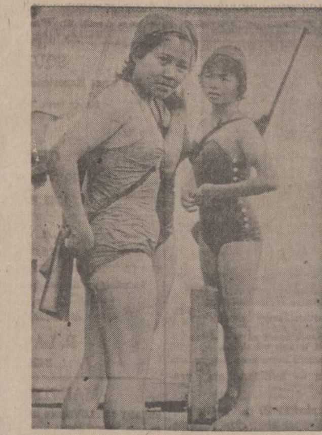
Vietnamo komunistai įtraukė į kovą paveiksle matomas šias dvi partizanes. Jos ir maudytis eidamos nepalaidžia šautuvo iš rankų. Bijo, kad kas jų neužpuolų.