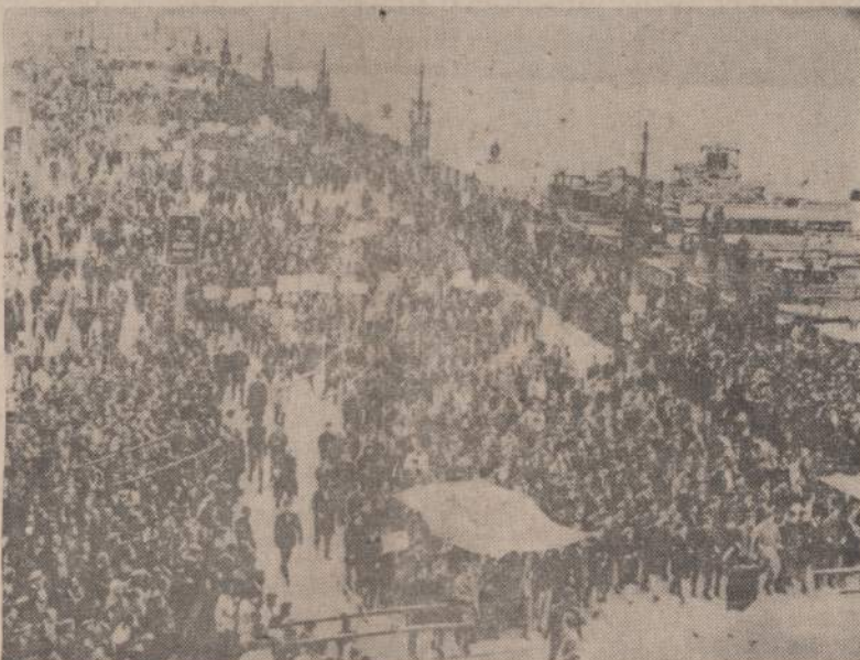
Turkai, patyrę apie graikų partizanų užpuolimą Kipro saloj ant turkų kaimelio gyventojų, Stambule suruošė dideles demonstracijas, kuriose jaunuoliai reikalavo keršyti graikams. Paveiksle matome protestuojančius turkus.

Klaipėdoje įsitaisęs valstybinis rusų žvejybos laivynas stokoja jūreivių darbininkų: skelbimai laikraščiuose kviečia stoti į tą darbą, net ir neišėjusius privalomojo mokslo (net ir pradines mokyklos nebaigusius). Žadamas atlyginimas — 220-250 rublių per mėnesį ir nemokamai maistas bei darbo apranga. Bet įsakymai pabrėžia, kad buto (šeimai) netenka tikėtis. Gyventi teks arba laive, arba