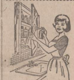
Savo namine valstyvą spintėlę reikia nepaprastai svariai ir tvarkingai užlaikyti, kaip šimame vaizdelyje parodyta: išimti visas konketes ir išmągoti lentynas; patikrinti visus užrašus, kad neįvyktų klaidų, nes valstyvų samūšimas gali būti fatališkas, patikrinti, kokiu valstyvų trūksta ir juos papildyti kad būtų bet kokiam netikėtumui pasiruošęs.

Help Keep Our Economy Strong BUY U. S. SAVINGS BONDS