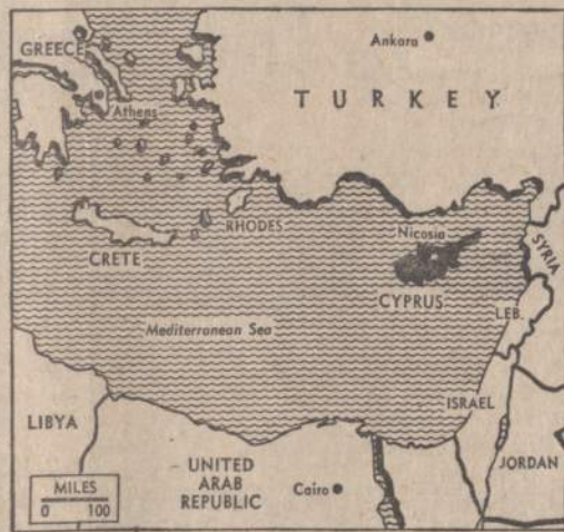
Kipro saloje graikų ginkluota gauja užpuolė ramų turkų kaimelį ir nužudė 25 turkus. Santykiai tarp graikų ir turkų labai įtempti, gali kilti karas. Jungtinės Tautos stengiasi išvengti konflikto.

LONDONAS. — Dviejuose laivų susidūrimuose nuskendo vienas norvegų ir vienas rytinių vokiečių laivas. Iš abiejų įgelių žuvo tik vienas jūreivis.