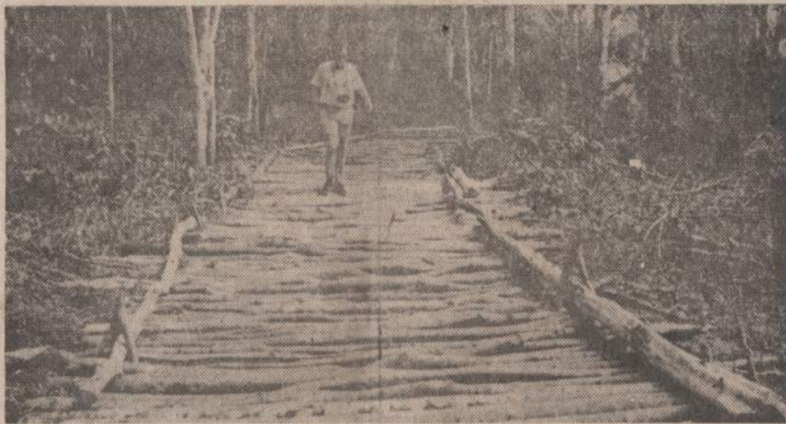
Kambodijos princas visa laika tvirtina, kad jo valdomos teritorijos komunistai nenaudoja. Tuo tarpu šiomis dienomis trijų kilometrų atstumu nuo Vietnamo sienos, Kambodijos miškų tankynėje rastas šis komunistų pravaistas kelias j komunistų kariuomenės ir sandėlius.

Šerius metus gautame viengungiška butuke ir vis dar laukia, kada ateis ir jam eilė gauti kiek erdvesnį butą... Pinigais butai sovietinėj sistemoj pigūs, bet kad būtų gautum, dažnam tenka sumokėti kuo kitu. D. Šova, atrodo, jau bus įnešęs užpirkimo duoklę. (E)