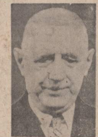
Prancūzijos prez. de Gaulle vakar aštriai pasisakė prieš JAV dolerį, kuris siekia pakeisti auksą kaip valiutos pagrindą. Vakar Paryžiaus biržoje auksas buvo nupirktas už 13 mil. dolerių.

SAIGONAS. — Amerikos ambasadorius Vietnamo Bunkeris pareiškė, kad jis Amerikoje pastebėjęs daug nesupratimo Vietnamo situacijos. Vienas toks nesupratimas esąs nuomonė, kad pačių vietnamiečių kariuomenė nieko neveikianti. Tiesa esanti visai priešinga.