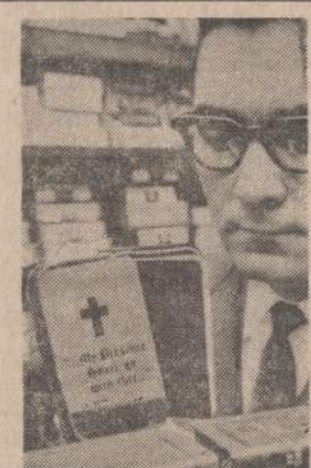
Antrojo Pasaulinio karo metu daugelis karių, turėjusių šarvuotą kšeningą bibliją, išvengė sužeidimų. Biblijos šarvas sulaukydavo kulkas. Dabar vienas biblijaris šarvuotas biblijas siuntinėjams į Vietnamą.

SAIGONAS. — Amerikos ambasada Saigone paneigė žinias, kad ji be Pietų Vietnamo vyriausybės žinios kalbasi su Viet Congo atstovais.