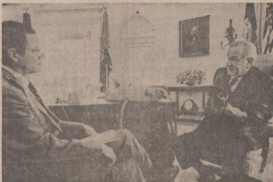
Prezidentas Johnsonas kalbasi su buvusiu krašto apsaugos sekretorium Robert McNamara. Sklido gandai, kad prezidentas nesutiks su McNamara Vietnamo karo klausimais, bet abu tvirtina, kad jų nuomonės nesiskiria.

Žvalgyba praneša, kad Laos teritorijoje laikoma apie 15,000 Šiaurės Vietnamo kariuomenės. Kadangi ženevos susitarimas neleidžia Pietų Vietnamui ar amerikiečiams pažeisti Laos teritorijos, tai komunistai ten daro, ką nori.