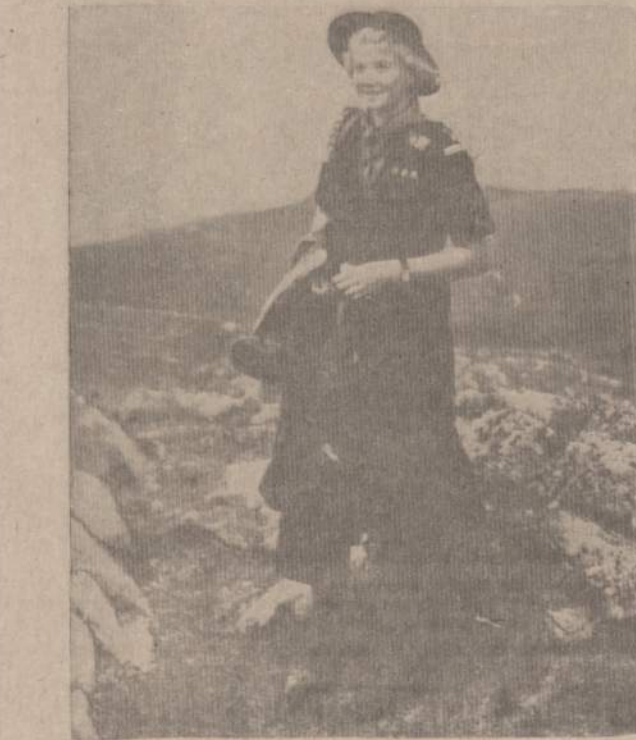
Norvegė skautė linksma, laiminga, ji džiaugiasi tėvynės gamta, Norvegijos laisve... Šio didžio džiaugsmo — laisvės jėgi linki ir LJ Skautijai.

dvasiniam polėkiams ir poreikiams. Grupinė draugystė jaunas žmogus — jaunuolis (lė) randa moralinį atsparos tašką, tam tikra prasme randa ir saugumą, turi sąlygą pažinti dau-