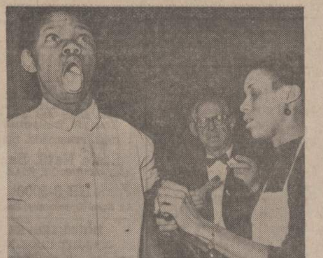
Chicago mokinė negrė liežuvį iškišo, kai kita negrė jai išvirktos vaisty. Sako, kad ne taip skauda, kai išvirktumas daro baltosios slaugės.