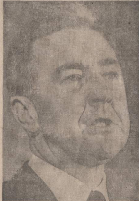
Minnesotų demokratų senatorius Eugene McCarthy paskelbė, kad jis bandys gauti demokratų partijos nominaciją krašto prezidento pareigoms. Jis nepritaria prezidento Johnsono politikai Vietnamo