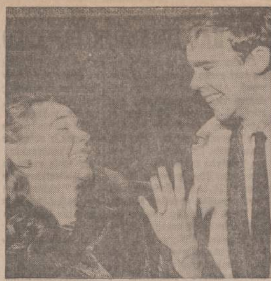
Buvusio viceprezidento Nixono dukte Julie džiaugiasi vertingu žiedu, kurį tai ant piršto užmovė buvusio prezidento Eisenhewerio anūkas David Eisenhower. Prieš 14 metų lietuvi susipažino Baltuose Rūmuose, o praėjį savaitę susiliedavo.

"NAUJIENAS" SKAITO VISŲ SROVIŲ ŽMONĖS: DARBININKAI, BIZNIERIAI, PROFESIONALAI, DVASININKAI, VALSITYBININKAI, MOKSLININKAI. JIE ŽINO, KAD "NAUJIENOS" PADUODA TEISINGIAUSIAS ZINIAS IR GERIAUSIAS PASTUS