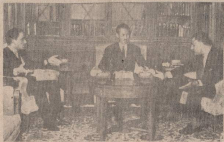
Jordano karalius Hussein, Alžiro prezidentas Boumedienne ir Egipto prezidentas Nasseris neseniai svarstė, ka arabams foliau daryti ir kaip atsilikti iš Izraelio arabų žemes. Alžiro prezidentas siūlo foliau kariuoti, o kiti du arabu vadai aiškina, kad jie neturi pakankamai karo jėgų ir pinigų naujam karui.

Dalinį sudaro 1,682 jūreiviai ir 1,990 armijos vyrų. Jiems vadovauja 111 laivyno ir 130 armijos karininkų. Ši grupė juda Vietnamo upėmis, niekada ilgai nepasilikdama vienoje vietoje. Priešas niekada nežino, kur pa-