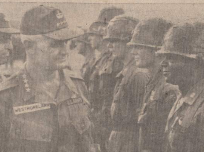
Generolas Westmorelandas, vyriausias Amerikos karo jėgų vadas Pietų Vietname, aplanko pasižymėjusį dalinį.

♦ Pietų Vietname upių karo dalinys padarė komunistams sunkią nuostolių, kai jie bandė perkirsti kelią į Saigoną iš Mekongo žemumų. Žuvo apie 200 Viet Congo.