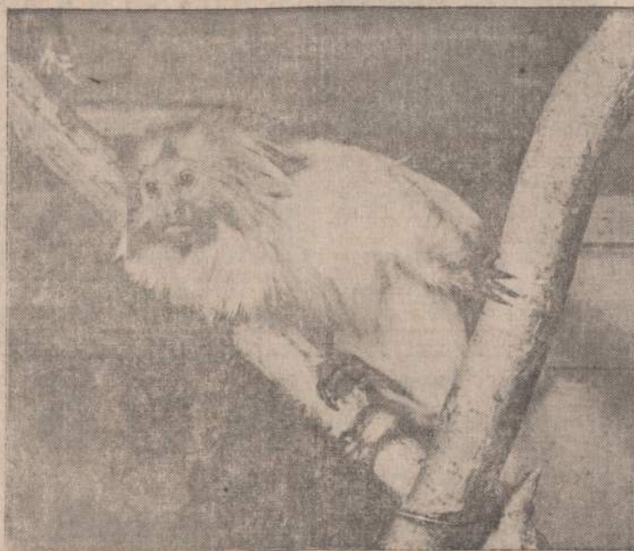
HIPPIE? KUTVELA? NE, TAI BEZDIONE LEONTIDEUS ROSALIA

Si bažtonikė, vadinama auksinis marmosetas, o mokslininkai Leontideus rosalia, yra paskirta Linkolno žvėryno gruodžio mėnesio "gražuole". Iš savo galvos, veido ir plaukų spalvos ji panaši į maziuką liutuką, dėlto ir gavo leontideus vardą. Jos tėvynė yra rytinės Brazilijos giriu galūnėse. Jos gyvena mažomis šeimomis iki 10 ar 15 galvų ir okupuoja kelių akrų teritoriją, kurioje medžio vabalus, driezus, paukščius ir jų kiaušinius ir renka vaisius, ir savo teritoriją "dėdvyriškai" gina nuo agresorių. Jos šokinėja iš medžio galūnės į kita ir gali kristi žemėn iki 45 pėdų visiškai nesusižeidamos. Marmosetą galima aplankyti Linkolno parko žvėryno Mažųjų gyvulių name.