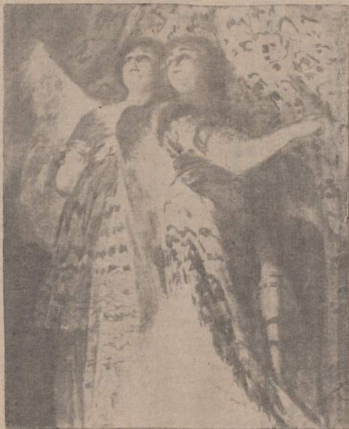
FRANCESCO GOYA Y LUCIENTES

Su kompiuteriais ir elektronika atėjo į garsų pasaulį naujų galimų. Juos ėmėsi išnaudo-