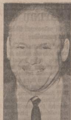
Dr. Sam Sheppard buvo nuteistas už pirmos žmonos nužudymą, bet vėliau buvo paleistas iš kalėjimo. Dabar jis veda vokiečių ir gyvena prancūzų Rivieroje. Jam sunku gauti gerą darbą, užtat jis kreipiasi į Tautos Korpuso vadovybę, kad priimtų ir naudotų jo patyrimus. Atrodo, kad ir Tautos Korpuso vadovybė nenori skubėti.

Gal kiek bereikalingai buvo ilgiau sustota prie klausimo, ar šalia amerikiečių Garbės komiteto sudaryti panašų komitetą iš lietuvių. Vienai manė, kad reikėtų sudaryti pagrindinių mūsų organizacijų pirmininkų ir kitų užsipelniusių lietuvių komitetą ir jį skelbti minėjimo programoje. Kiti galvojo, kad toks "garbės sąrašas" bus nelengva sudaryti. Jis galės atnešti ir nemalonumų, jei įrašius vieną, kitas bus pamirštas. Ši