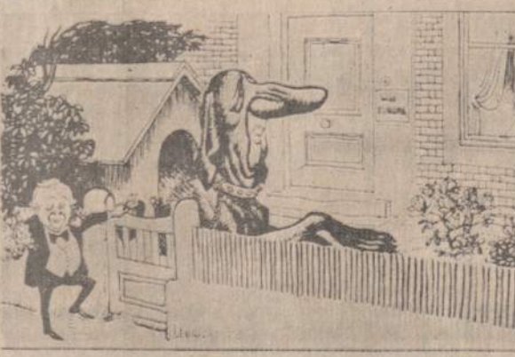
Šitai britų žurnalas "Punch" išvaizduoja Britanijos kelis į Europos Bendrąją rinką. Premjeras Wilsonas mielai norėtų iesti į Europos namą, tačiau jam kelią pastoja piktas sargas.

Amerikos konsulato Bremene sienos ir langai buvo nutepti svastikomis ir priešamerikietiškais užrašais. GASBUGGY SITE. — Pirmą kartą atominis sprogimas buvo panaudotas Naujoje Meksikoje komerciniams tikslams. Dujų bendrovė giliai po žeme išsprogindavo stiprų užtaisą. Sprogimas leis bendrovei išnaudoti toje vietoje esančius natūralių dujų rezervus. Sprogimas bendrovei kainavo 4.7 mil. dolerių.