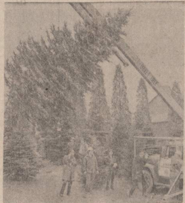
Baltuose Rūmuose bus iš 18 pėdu Kalėdų Eglutė, kurią darbininkai paruosia išvežimui į Washingtoną. Ji užaugo Ravenna, Ohio eglyčių ūkyje.

Bliesze, 27, gyv. 3950 S. Western, suimtas ir apkaltintas žmogžudyste.