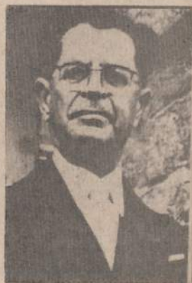
Graikijos premjeras Kiliassis ir kariuomenės tarybos vadovas generolas Spandidakis. Viduryje matomas graikų kariuomenės tankas Atėnų gatvėje. Po paskutinio įėjimo tarp Graikijos ir Turkijos dėl Kipro salos, graikų diktatūrinės vyriausybės padėtis pasunkėjo, nes ji turėjo turkams nusileisti.

Bonoje manoma, kad šį kartą sovietai, skelbdami notą apie Vokietijos grėsmę taikai, norėję paveikti Rytų Europos valstybes. Rumunija yra pasiruošusi užmegzti su Bonos vyriausybe diplomatinis santykius. Greit bus atidaryta Vokietijos ambasada Jugoslavijoje. Ypačiai dėl šių naujų ryšių nerimauja Ulbrichtas, kuris vėl vakar išskrido į Maskvą pasitar-ki.