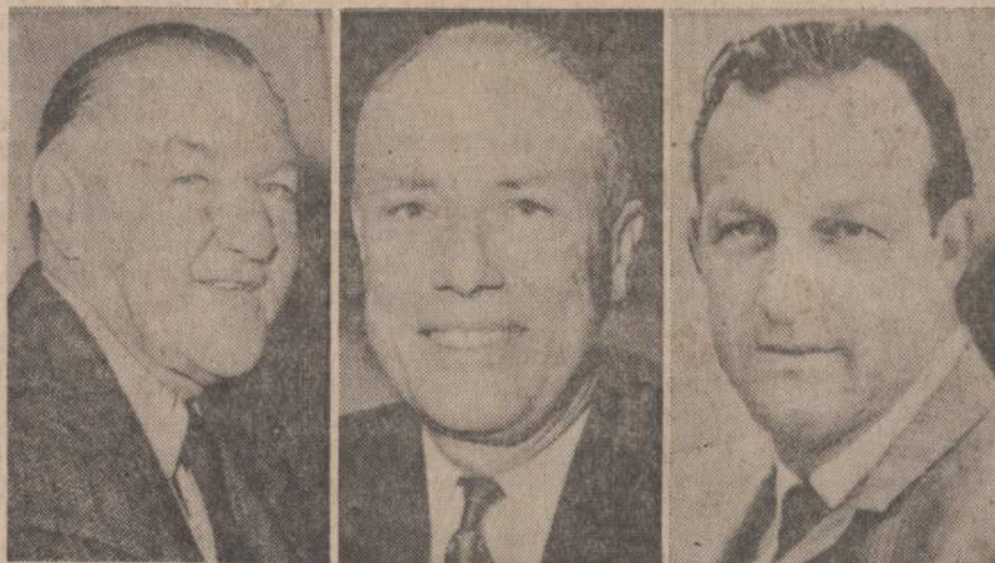
Sportininkai (iš kairės į dešinę) Johnny Murphy, Bing Devine ir Stan Musial. Pastarasis pasitraukė iš Cardinals, nes jam dabar labiau rūpi beisbolas. Devine tapo St. Louis grupės menadžeris, o Murphy tvarkys New Yorko Mets.