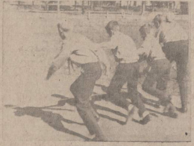
ŽAIDIMAS IŠKYLOJE Pirmyn prie nurodyto tikslu.