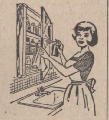
Savo namine valsty spinteje reikia nepaprastai švariai ir tvarkingai užlaikyti, kaip šiame vaizdelyje parodyta: išimti visas bonkutes ir išmazgoti lentynas; patikrinti visus užrasus, kad neįvyktų klaidų, nes valsty sumaišymas gali būti fatališkas. patikrinti, kokiu valsty trūksta ir juos papildyti kad būtum bet kokiam netikėtumui pasiruošęs.