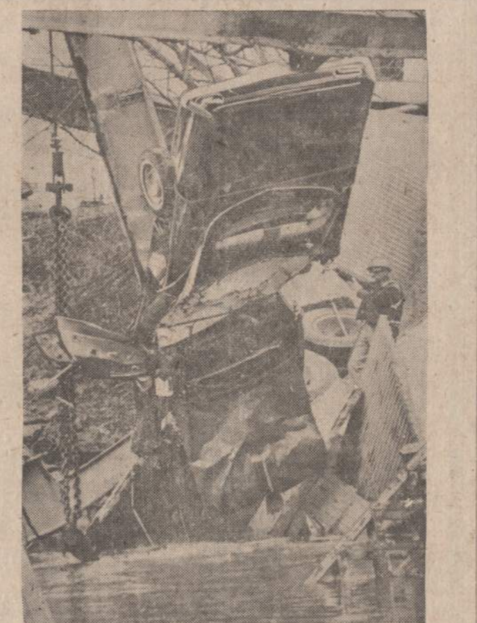
Sidabrinis tiltas, buvęs tarp Ohio ir West Virginia valstijų, sulinko ir nukrito į Ohio upę. Nuskeno apie 40 automobilių, nelaimės metu važiuosiu kito upės pusėn. 16 lavonų pavyko ištraukti. Paveikslė matome iš vandens traukiama automobilį.

Continental restorano delikatesų skyrius, 3131 So. Halsted St., turi paruošę jūsų Kūčių ir Kalėdų stalui įvairių skanių maisto patiekalų. Įvairiai pagamintų silių ir daržovių mišrinių, farširuotos žuvies, keptų ančių, žąsų, kalakutų, kumpių, jauno paršuko rolado, virtinių su grybais, su plaučiu-kais, su mėsa. Taip pat galėsite gauti šliūzų, agunų pieno ir spanguolių kisieliaus. Užsakykite telefonu 842-9559. (Sk)