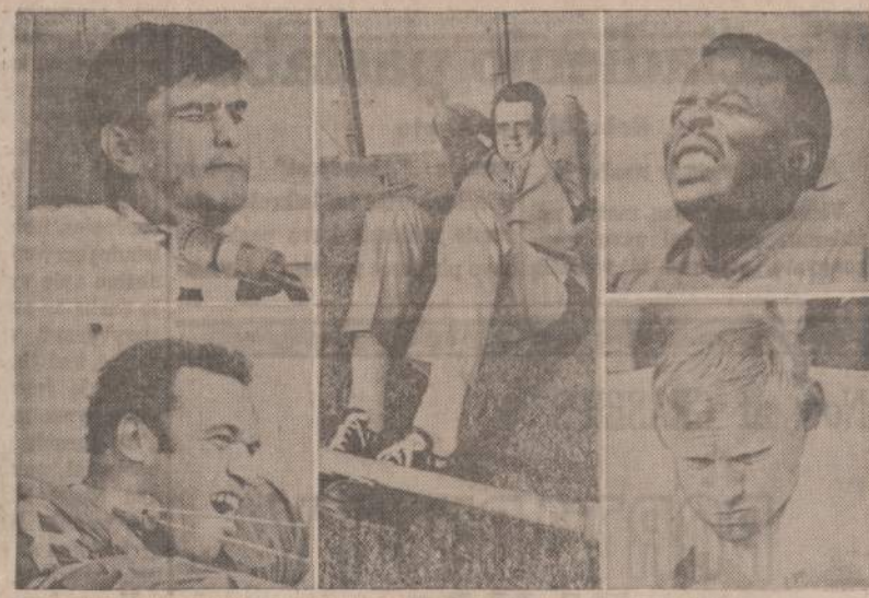
Los Angeles Rams grupės žaidėjai rengiasi žaisti su Baltimorės Colts.