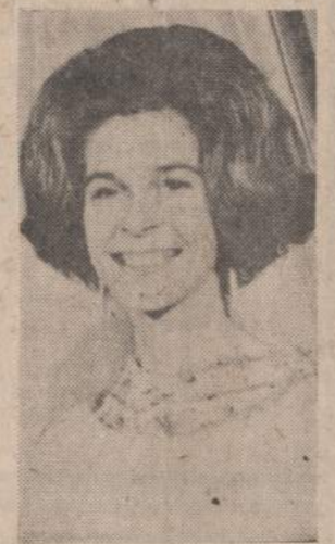
Jeigu sukile Graikijos generolai nesuistars su karaliu Konstantinu, tai jie yra pasiryžę kvieisti 25 metų amžiaus karaliaitę Ireną būti krašto regentu.

kompanijos pirmininkas Chicagoje, sukeldamas daugiau kai 22 milijonus dolerių. Siemetau jau parduota bonų už 15 milijonų dolerių ir iki metų pabaigos tikimasi dar parduoti už porą milijonų.