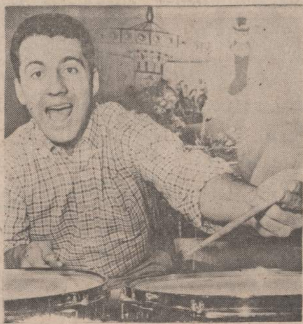
Bostono Red Sox žaidėjas Rico Petrocelli žaidžia dviem bubnais. Atrodo, kad jis nori pramokti naujo amato.