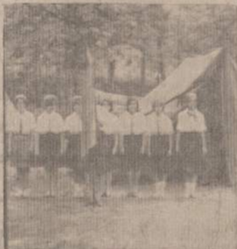
PRIEŠ RYTINĮ PATIKRINIMĄ