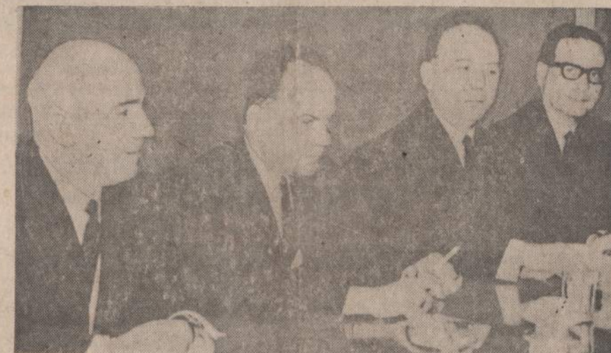
Graikijos nauji valdytojai. Iš kairės į dešinę sėdi: vidaus reikalų ministras Stylianos Pattakos, premjeras gen. George Papadopoulos, kelių ministerijų koordiniatorius gen. Nicolas Makarezos ir įtakos neturintis tarnautojas.

kraštų. Jis visą laiką palaikė artimus ryšius su sovietų žvalgyba. Teko jam lankytis ir Maskvoje. Vieno tokio apsilankymo metu jis buvo apdovanotas Raudonojo Darbo ordinu. Pagaliau jo darbas pasidarė labai sunkus ir sovietai nutarė jį išgelbėti iš pavojaus būti atidengtam. Jis buvo atsauktas į Maskvą, kur dabar gyvena ir rašo savo prisiminimus. Ižvestijos išspausdinimo pasikalbėjimą su Philbio savo saugumo organizacijos 50 m. proga. Britų žvalgyba Philbio parodyta apvertkinoje šviesoje. Vienas svarbiausių jos vadų faktiškai visą gyvenimą buvo sovietų šnipas.