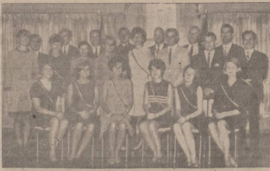
IS AKADEMIKŲ SKAUTŲ METINES ŠVENTES Worcesterio akademikai skautai su svečiais iš kitų Atlanto rajono vietovių.

Artėjant 1968-šiemis, pažvelkime į nueitą kelią, ar pakankamą duoklę įdėjome, jei ne — sukruškime, pakilkime iš apsnūdimo. Žinokime, kad mūsų