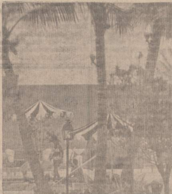
Paradise salos pakrantė

Pirmiausia apžiūrėjome Fin-castle pilį. Ji stovi netoli miesto, ant nedidelio kalno. Įėjimui padaryti laiptai, kurie yra iškalti iš akmenų. Laiptų sienų aukštis yra virš 30 pėdų. Visas darbas čia atliktas paimtu į nelaisvę vargų. Darbas atliktas be jokių mechaninių priemonių. Belaisviai — vergai čia dirbo ir mirė. Kita Charlotte pilis yra viena iš didžiausių. Čia į viena sujungtos trys pilys. Ji žymi tuo, kad čia yra daug požemių urvų, kuriuose buvo laikomi ir kankinami belaisviai ir jų vada. Vienas kambarys įrengtas su visokiais kankinimo įrankiais ir vaškintais žmonių figūromis. Šiurpas nukrečia žiūrint į tuos