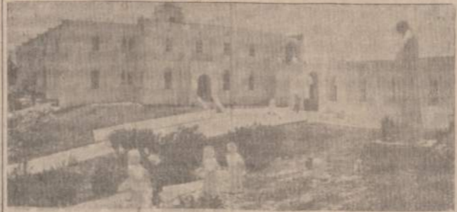
Saint Augustine vienuolynas

Sala, ant kurios stovi Nassau, vadinasi Bahamas Providence Island. Ilgas tiltas su ja jungia Paradise Island. Užsimokėję tilto mokestį, nuvykome į tą salą pasivažiuoti. Matosi daug prabangių motelių, apsidintų jvairiais medžiais ir gelėmis. Prieplaukoje daug jvairaus didumo laivelų. Jie išnuomojami pasivažinėjimui ir žuvavimui. Su laivu žuvavimui važiuoja 3 žu-