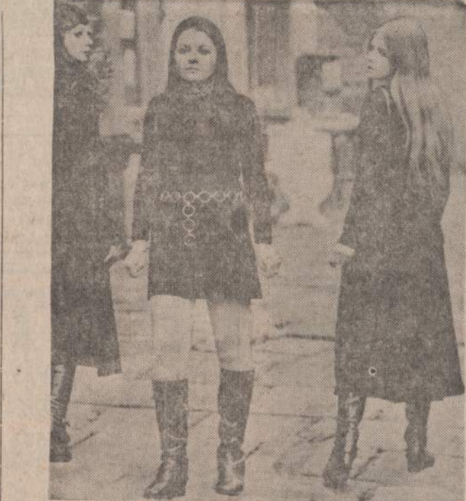
Londono gatvėse jaunos panos žiūri viena į kita šalta žiemos diena. Vienos dėvi senus ilgus sijonus, o antrosi žingsniuoja su moderniu trumpu sijonėliu. Kuri geriau jaučiasi — sunku pasakyti.