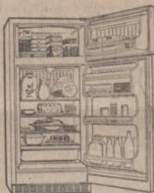
CTA212H (a) - 1-1/2'