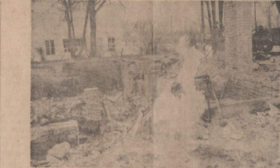
Dunreith, Indianoj nuo bėgių nuoko traukinys su nuodu ir degančių skysčių pilnais vagonais. Visi miestelio gyventojai turėjo palikti savo namus. Gaisras sunaikino daug vagonų ir namų bei paskleidė apylinkėje nuodingų dujų.

Grįžtant prie mirties klausimo, gali atsitikti, kad žmogui žuvus kokioje nelaimėje, chirurgai jo organus perkels į kitus kūnus. Čia glūdi galimybė, kad mirtinai sužeistam asmeniui gydytojai gali paskubėti išimti kurį nors sveiką organą, norėdami išgelbėti kitą sergantį, kuriam tokio organo reikia. Ar turi teisę gydytojas laukti paciento mirties, kad galėtų gelbėti kitą pacientą? Ar jis dės visas pastangas išgelbėti sergantį, jei jam rūpės išimti ir kitam duoti kurią nors jo dalį?