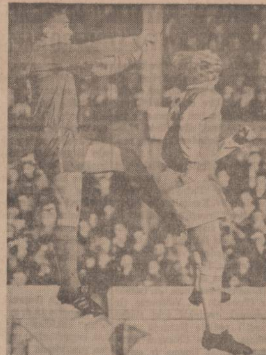
Futbolo rungtynėse padaryta fotografija rodo du Anglijos kofino žaidėjus. Atrodo, kad vienas jų spiria ne į futbolą, bet pataikė savo priešininkui.

Apylinkėse vyksta pagrindinė mūsų gyvenimo. Dėl to ir apylinkių susirinkimuose bus išlietuvių laukinama minčių ir siūlymų, kaip geriau tuos metus paminėti. Laisvinimo veiksniai ir vadovaujantieji LB organai