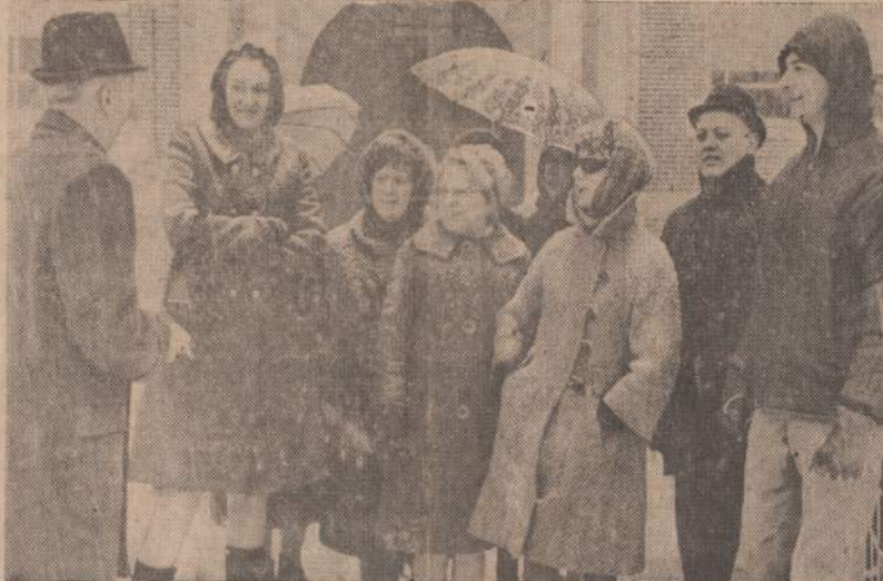
Waterbury, Conn., mokytojai nutarė streikuoti. Lauke šalta, sninga, bet mokytojai atsiskė mokyti. Miesto savivaldybė patraukė mokytojus teimam ir uždarė mokyklas. Lauke matome piketuojančių mokytojų grupelę.

ir neužtenka. Castro pasigyrė, kad 1960 metais Kuba turėjo 3,200 traktorių, o dabar vartoja jau 35,000 traktorių. Daugžibalo suvartoja nauji Kubos fabriai.