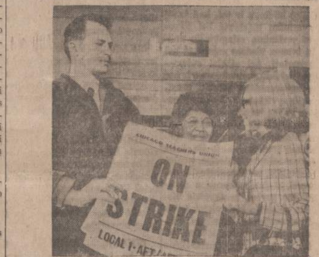
Chicago mokyklų mokytojai reikalauja pakelti jiems algas $650.00 metams. Jeigu tokios sumos jie negaus, tai sausio 9 dieną jie rengiasi streikuoti. Eina pasitarimai tarp mokytojų unijos atstovų ir miesto švietimo komisijos.

• Vienas vienintelė šviesi mintis gali visą dieną apšviesti.