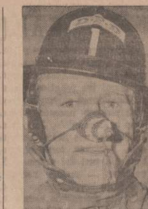
Vieniem šala rankos, o kitiems šala kojos; tuo tarpu paveikslė motomam Denver, Colo., ugniagesiui labai šala nosis. Jis nusimezge specialų maišeli nosiai nuo šalčio apsaugoti. Šalčių metu jis nesigedina su šiuo maišeli vaikščiodi.

Priedus: (Daktarui): jeigu žmogui nėra vilties pasveikti, ar beveik nėra — negydyti, nepašimoka; (skęstančiam jūroje): nesitverti už laivo skeveldros ir nemėginti plaukti, nes vis tiek nuręsi dugnan!