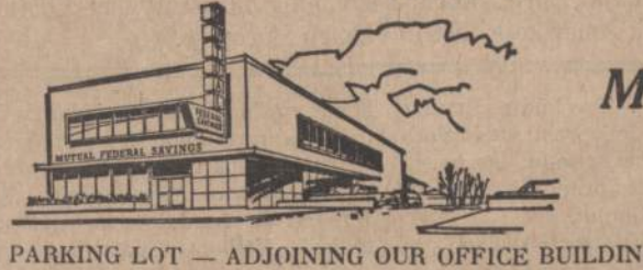
PARKING LOT — ADJOINING OUR OFFICE BUILDING

5 1/4% Mokamas už vienų metų taupymo laktus nuo išdavimo datos ($10,000.00 ar daugiau, įdedant po po $1,000.00)