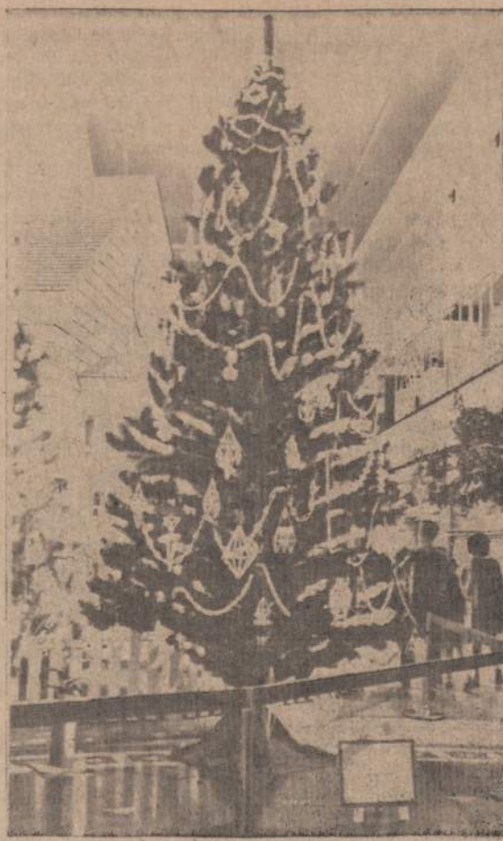
Lietuvių kalėdinė eglutė 1967 m. Čikagos Mokslo ir Pramonės muziejuje susilaukė savo šiaudinukų rankų darbo puošyba lankytojų ir vadovybės pripažinimą ir premiją.

Civilines bylas gali kelti kiekvienas pilnateisis gyventojas, su neaprežto didumo ieškiniu, plus moraliniai pergyvenimai, kurie, pagal vietines teises, taip pat gali būti įvertinti pinigais. Reikia tik aiškiai formuluoti skriaudą, ribotis civiliniame ieškinyje ir turėti tikrą atsakovą. Bylinėjimosi išlaidos yra tiesioginiai proporcingos ieškimo didumui. Bylų rūšių gali būti tiek, kiek yra skirtingų prasilenkimų su sutartimis, kaip: įvairūs užrašai, tautiniai ženklai, sugadintos fotografijos ir t. t. Čia pavyzdėlis. Žmogus dar būdamas pilnoje sąmonėje, nurodydam asmeniui testamentu paliko $10,000 su sąlyga, kad jis būtų palaidotas šv. Kazimiero kapinėse, bet ne kitose, nes