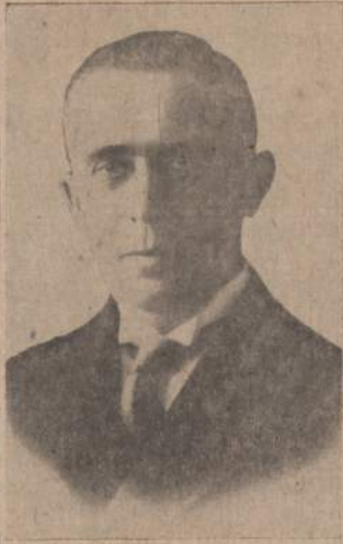
Lietuvos atstovas Anglijoje B. Balutis š. m. sausio mėn. 5 d. buvo pavlaidotas Londono katalikų kapinėse, kuriose yra ir lie-tuvių skyrius. Buvo norima ve-

lionies palaikus parvežti į Chi-cagą, bet vėliau nuo tos minties atsisakyta, nes paašikėjo, kad Balutis prieš mirtį buvo parei-kęs norą būti palaidotu Londone. Jo kilnioje asmenybėje lietuvių išėivijoje prarado daug lietuvių dirbusio ir nusipelnu-sio mūsų tautos patrioto.