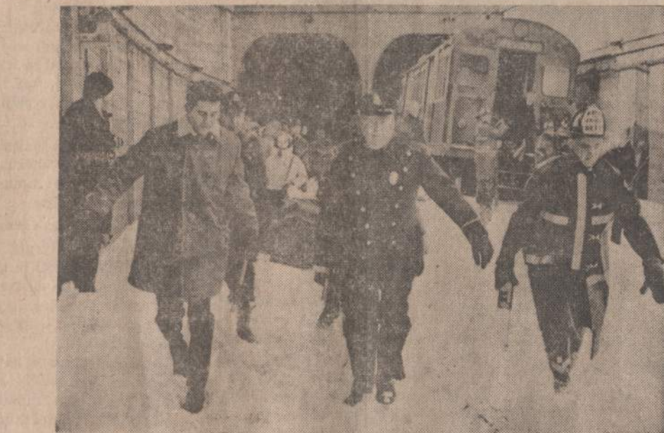
East Bostono tunelyje susidūrė du keleiviniai traukiniai. Nelaimės metu sužeista apie 50 keleivių. Ugniagesiai neša sužeistuosius į ligoninę.

Bandras Kubos kongreso tonas ligšiol yra pulti Ameriką, garbinti revoliuciją ir kovą prieš „imperializmą“.