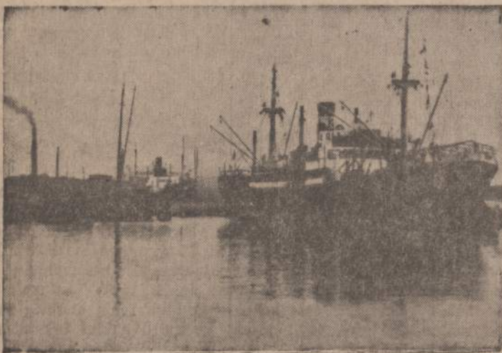
Prekiniai laivai Klaipėdos uoste.

Klaipėdos Buriavimo Mokykla rucšė vadovus ir instrukto-