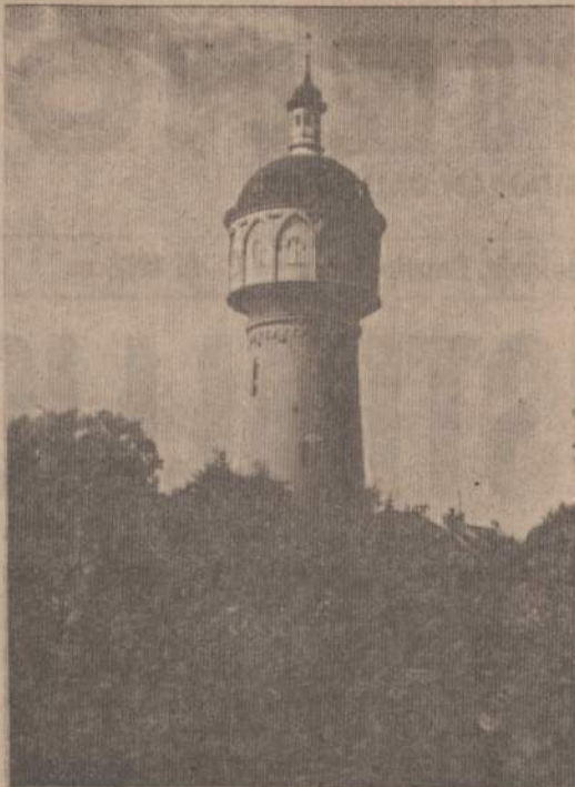
Klaipėdos uosto švyturys