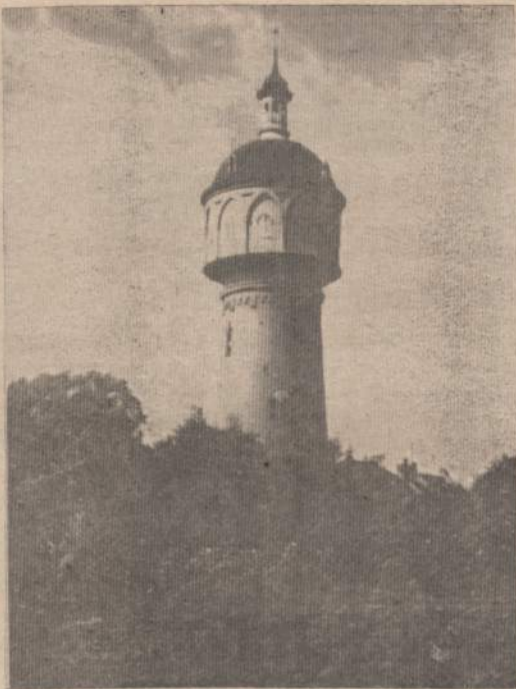
Klaipėdos uosto švyturys