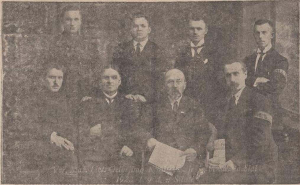
MAZOSIOS LIETUVOS GELBĖJIMO KOMITETAS