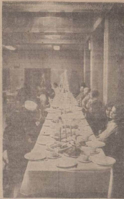
LJS Juodkrantės Skaučių ir Baltijos skautų tuntu kūžios. Nuotraukoje matoma dalis pačių skaučių ir svečių.

rius — jų aptarėjas, spaudai pateikėjas ir pastebė, kad pajūrio vėjeliai neturi įtakos navigacijai, bet navigatoriams bus įdomu apie juos žinoti, juos pažinti, ypač jaunimui besirengiančiam į navigatorius. Tad jų žiniai ir pateikiame pajūrio vėjelį vardai.