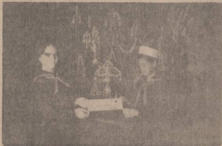
O kaip malonu džiaugtis savo darbu vaisiais... Juodkrantės tunto skautės stovi prie papuoštos eglutės savo rankdarbiais — tautinių motyvų šiaudinukais.