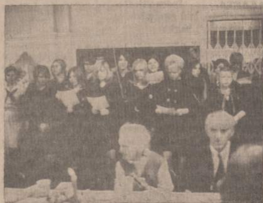
Juodkrantiės linksmina lietuvių senelius Kalėdinėmis giesmėmis, Oak Forest ligoninėje.

ringiausių pietvakarių vėjų, su žvarbiu lietum, jūroj sukuriuotas ir klatingas, labai pavojin-