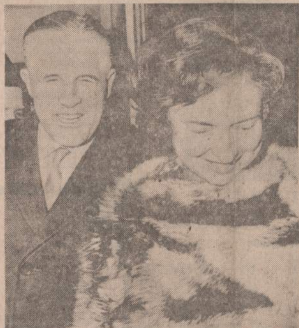
Michigan gubernatorius George Romney su žmona atvyko į New Hampshire valstiją, kad galėtų dalyvauti pirminiuose rinkimuose. Gubernatoriui teks vesti sunki kovą, nes New Hampshire respublikonai daugiau pritaria Richard Nixonui. Gubernatorius norėtų padebatuoti su Nixonu įvairiais vidais ir užsienio klausimais, bet Nixonas į debatus nelabai skuba.

SAIGONAS. — Senatorius Erwardas Kennedy lankosi P. Vietname, kur jis nori susipažinti su pabėgėlių globos klausimais.