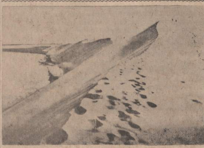
Nidos smėlio kopos Neringoje.