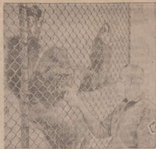
Texas zoologijos sode vadovybė įsitikino, kad gorilos labai greitai užkrečia sloga. Šią ligą jos gauna nuo žmonių. Zoologijos direktorius įsaka visiems prižiūrintėjams, turintiems sloga, dėvėti kvėpavimo kaukes. Paveiksle matome patį direktorių, belankantį Forth Worth, Tex., sode esančią gorilą.