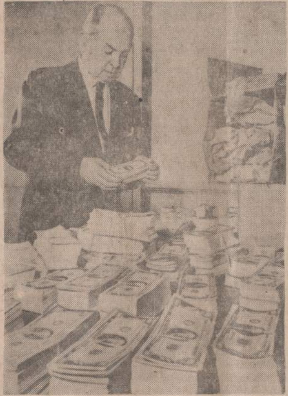
Didžiausias JAV istorijoje padirbtų pinigų grobis teko New Yorko slapto tarnybos inspektoriumi. Buvo rasta virš keturių milijonų dolerių banknotuose po šimtinę.

kaip ir šeši studentai, maždaug, vienas procentas, pareiškė, kad karinės pastangos Vietname turėtų būti išplėtos.