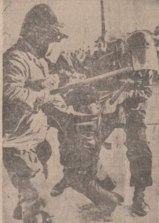
Japonijoje Sasebo policija veikia į šalį demonstrantą, kuris protestavo prieš JAV laivo atplaukimą į uostą. Demonstrantai žadėjo sutraukti 90,000 žmonių, bet japonai agitatorių jau nebeklauso.

U Thanto manymu pasitarimai dėl taikos galėtų prasidėti 3-4 savaitės po bombardavimo