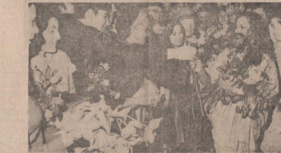
New Yorkan atskrido Indijos mistikas Mararisi Mahesh. Mistika pasitiko ir jam gėlių atnešė visa eilė jaunuolių. Artistė Shirley McLaine esanti Mararisi gerbėja. Šiomis dienomis jis rengiasi paskelbti pasaulio taikos planą.