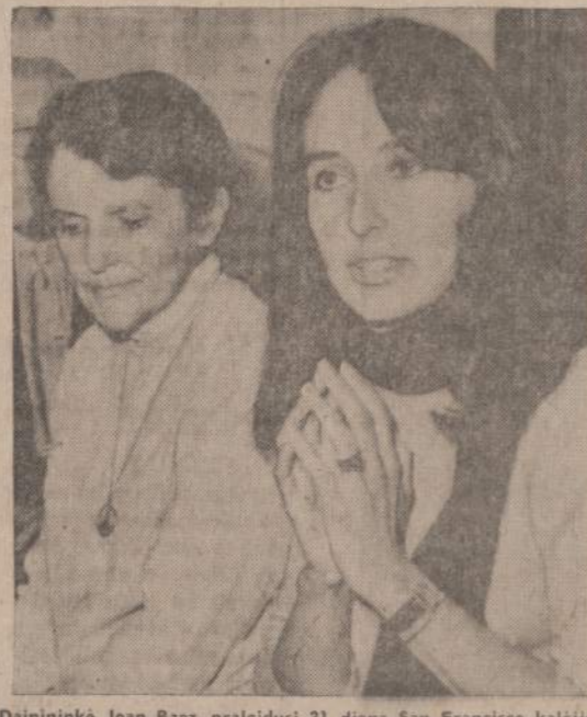
Dainininkė Joan Boez, praleidusi 31 diena San Francisco kalėjime, buvo paleista. Už tvarkos ardymą ir protestus prieš karo tarnybą ji buvo suimta ir nuteista 45 dienas kalėti. Tokia pačia bausmė gavo ir dainininkės motina. Abi kalėjime buvo labai ramutes. Bausmė sutrumpinta už gerą elgesį kalėjime.