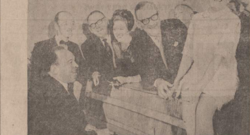
1938 metais paveikslė matoma grupė, Benny Goodmano vadovaujama, pradėjo grofi džiazą. Grupė išsikirsė, bet prasita savaitę, norėdami paminti su metų sukaktį, paveikslė matome juos vėl susirinkusius. Ant piano sėdi dainininkė Martha Tilton, o šalia jos matosi pats muzikas Goodman.