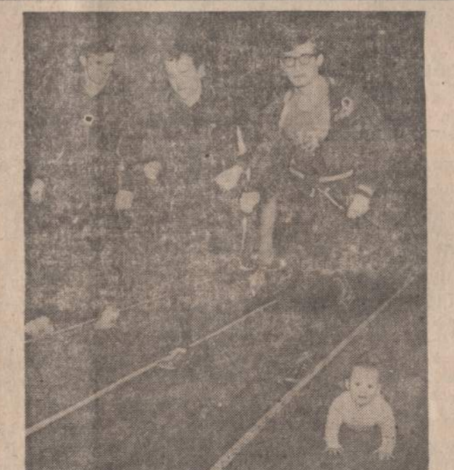
Pittsburgho Universitete jauni sportininkai mankština lenktynėms. Vieno sportininko 7 mėnesių sūnus taip pat nori pradėti begima, bet jis gali judėti tik keturiomis.

WASHINGTONAS. — Vyriausybė paskelbė savo tyrimų rezultatus apie Michigano ežerą užteršimą. Raporte sakoma, kad ežerą teršia 87 miestai ir 118 pramonės įmonių. Jei teršimas nesibaigs, tai Michigano ežeras greit bus miręs, panašiai, kaip Erie ežeras.