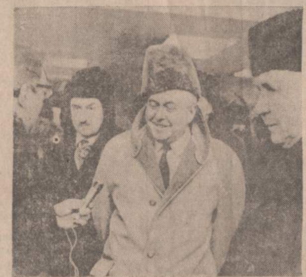
Britų premjeras Harold Wilson atvyko į Maskvą, kad galėtų pasitarti įvairiais užsienio reikalais. Wilsona aerodrome pasitiko sovietų premjeras Aleksej Kosyginas.

tucinė. Šis sprendimas jau sukėlė piktų komentary tikinčiųjų tarpe.