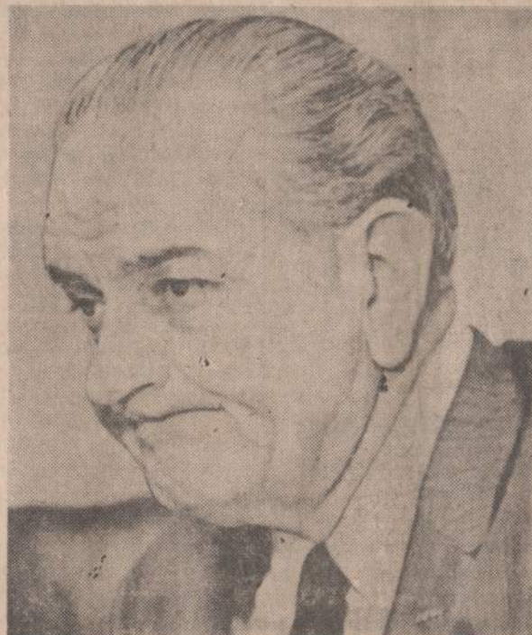
Prezidentas Johnsonas pašaukė karo tarnyboms dalį aviacijos ir laivyno atsarginių karių. Šiaurės Korėjos komunistai pagrobė laisvose vandenyse plaukusi JAV karo laivą "Pueblo" ir nesirengia jo grąžinti. Prezidentas nori išvengti konflikto, bet vargu galės.

PALERMO. — Sicilijoje nauji žemės drebėjimai užmušė 7 ir sužeidė 55 asmenis.