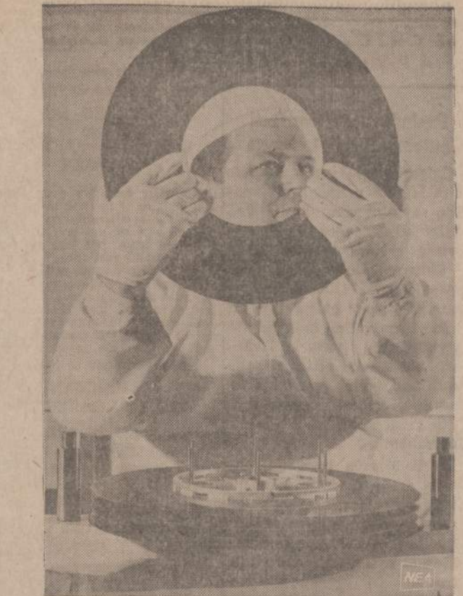
Anksčiau reikalingas informacijos laikydavo popieriaus lapuose, dabar viskas sandėliuojama plokštelėse. Pavelsio matome pačia naujaisią mašina, įvairioms informacijos užrašyti ir laikyti. Tvir-tinama, kad ši mašina greičiau ir tiksliau viską užtekduoja.