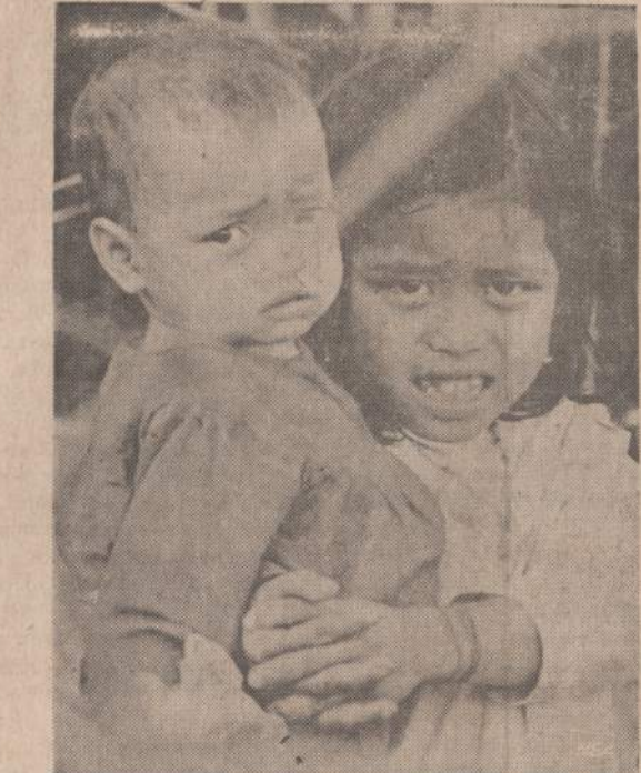
Vietname įsiveržė komunistai iš pasaly apsaudę Da Nango gyventojus. Paveiksle matomi jaunuoliai liko be tėvų ir pastogės.

Japonų laikraščio padarytos iš lėktuvo nuotraukos rodo, kad sovietų laivai plaukioja netoli amerikiečių lėktuvnešių. Visi trys Amerikos lėktuvnešiai susitiko į šiaurės rytus nuo šiaurės Korėjos uosto Pusan.