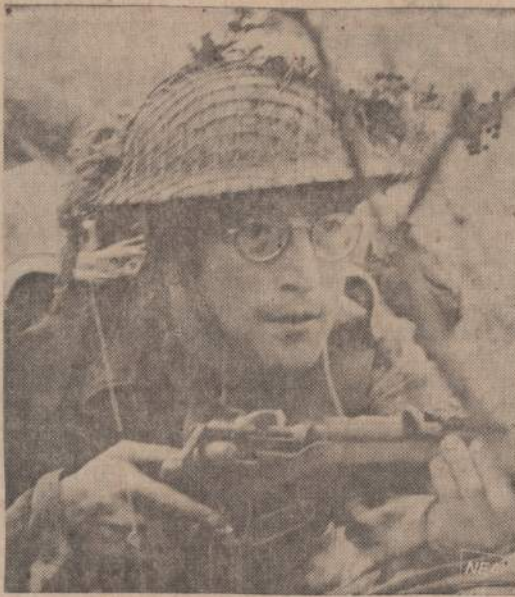
Gyvplaukiais ir nešukuotais plaukais apaugęs britų jaunas dainininkas ir šokėjas John Lennon dabar vaidina kino filme. Nusukto ir apvalyto jaunuolio mergaitės negali atpažinti.

To paties vėliavų kelimo būdo skautai laikosi ir tarptautinėse stovyklose "Jamborėse". 1967 "Skautų Aido" 7 nr. 153 pusl. "Lietuviai Tarptautinėje Jamborėje" vėliavų aikštėje suskaičiavo 24 stiebus su iškeltomis vėliavomis. Jų viename pažinau ir mūsų tautinę vėliavą. Ten stovyklavę lietuviai skautai siuntė visiems sveikinimus iš po savo vėliavos ir visų kitų. Ar bū-