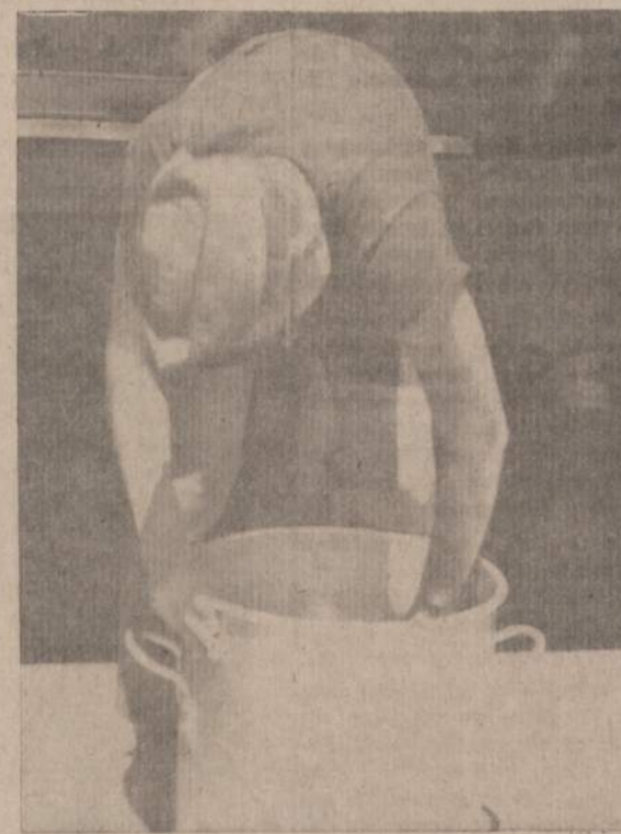
ARĖJA TAUTINĖ STOVYKLA, ARĖJA IR VISI MIELI IR NEMIELAI DARBAI