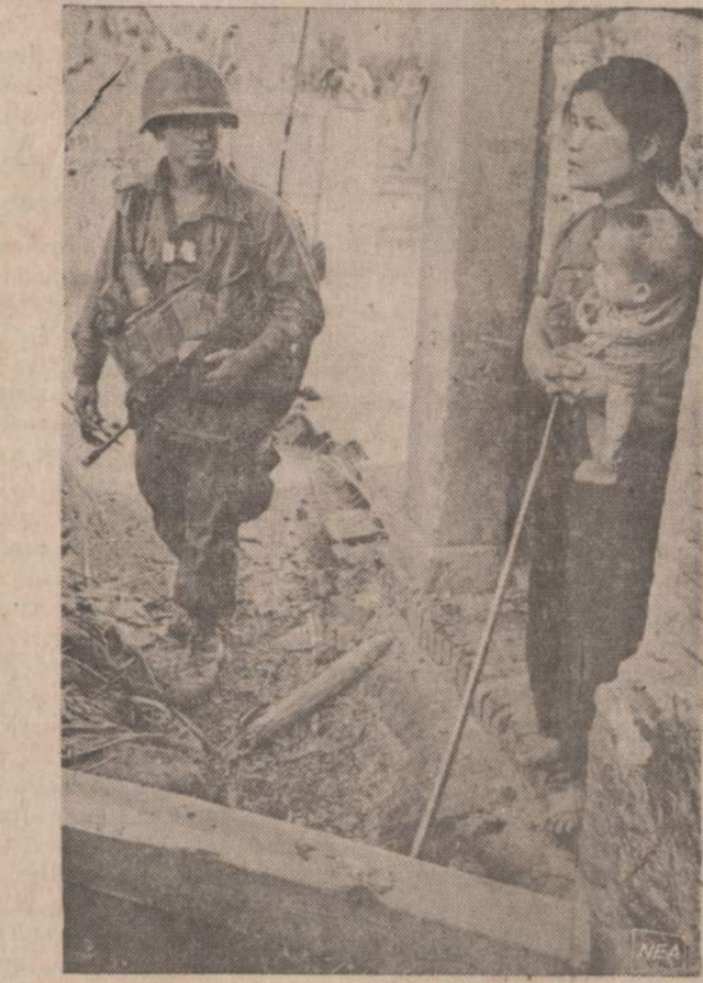
Da Nang priemiestij buvo įsistiprinę komunistai, kurie apšaudydavo JAV karius. JAV karys tikrina moterį su vaiku, išėjusia iš sugauto namo landynės.