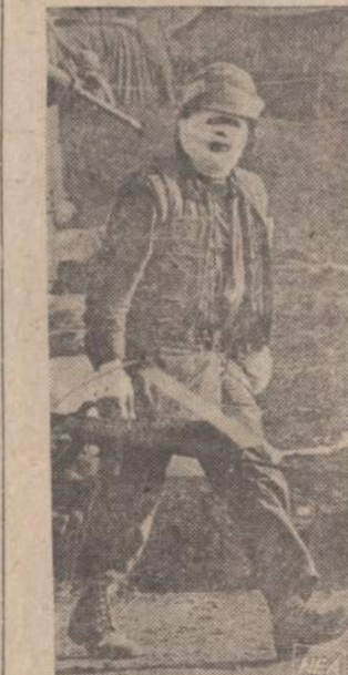
Vietnomo vakarinėje dalyje komunistai yra apsupę didokla skalčių Amerikos marinių. Paveiksle matome Khe Sanh srityje sužeista marina, žygiuojantį į pagalbą punktą.

New Yorke šiukšlių išvežėjų yra apie 10,000. Jų unija reikalauja metinio 600 dolerių algų pakėlimo, kuris pakeltų jų atlyginimą iki 7 tūkstančių dol. per metus. Jie reikalauja ir penkių darbo dienų, o už savaitę galūs siekia gauti didesnių atlyginimų — dvigubų sekmadieniais ir pusantrą karto — šeštadieniais. Darbininkams, kurie dirba naktį reikalaujama 10% pakėlimu. Darbdaviai tesūlo maždaug pusę to, ko darbininkai reikalauja. Todėl šiukšlių krūvos New Yorke gali dar padidėti.