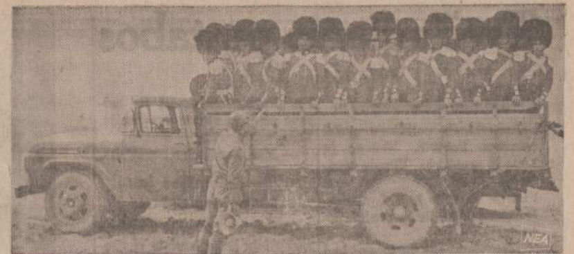
Turkijoje britų filmų bendrovė suka filmą "Lengvosios brigados puolimas". Kad greičiau galėtų pervesti "karius", vartoja sunkvežimį, ne arklis. Direktoriaus T. Richardson | sunkvežimį sukėlė 30 ginkluotų vyrų.

Griežtos priemonės gal ir užkirs kelią didesnėms riaušėms, bet jos nepašalins riaušių priežasčių. O kol tos priežastys nebus pašalintos, tol rasinė problema Amerikoje pasiliks labai opi.