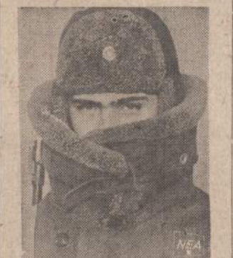
Šaltą žiemą vakarą suomių karys eina sarybas prie suomių prezidentūros.

Užsienio reikalų komitetas 8 balsais prieš 4 nutarė prašyti prezidento Johnsono, kad jis atsiųstų į komiteta valstybės sekretorių Ruską kalbėti apie Vietnamo reikalus. Sekretorius kelis kart atsiskak dalyvauti komiteto apklausinėjimuose, tačiau praėjusį sekmadienį ta tema kalbėjo televizijos programoje.