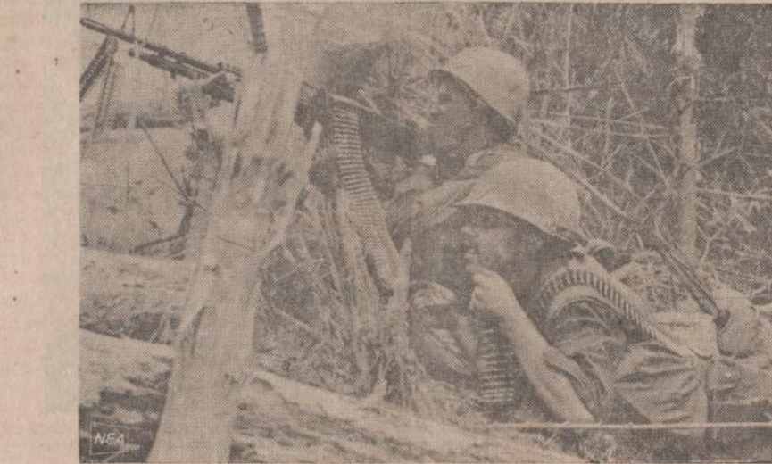
Vietname šiaurėje, visai prie demilitarizuotos zonos, komunistai sutraukė kelias divizijas, Manoma, kad prie demilitarizuotos zonos įvyks patys stipriausi mūšiai. Amerikiečių kulkosvaidžiai prie demilitarizuotos zonos.

Valstybės departamentas atsiskak komentuoti spaudoje pasirodžiusią žinią, kad Amerikos