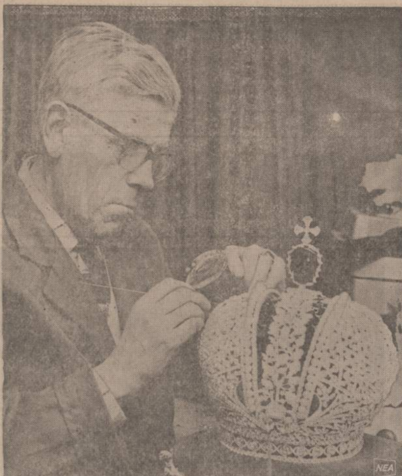
Galingosios Rusijos carai nešiodavo sukčių pagamintas menkevrėių brangenybiu karūnas. Vokiečių auksakalys Karl Posselt parodys, kaip buvo apgautas Rusijos caras Povilas I, vietoj brangenybiu, jo karūnoje buvo spalvuotas stiklas.

Dloco vadovybė dar prašo priminti, kad Lietuvos trispalvė prie Detroito miesto rotušės šimet bus iškelta ne minėjimo die-