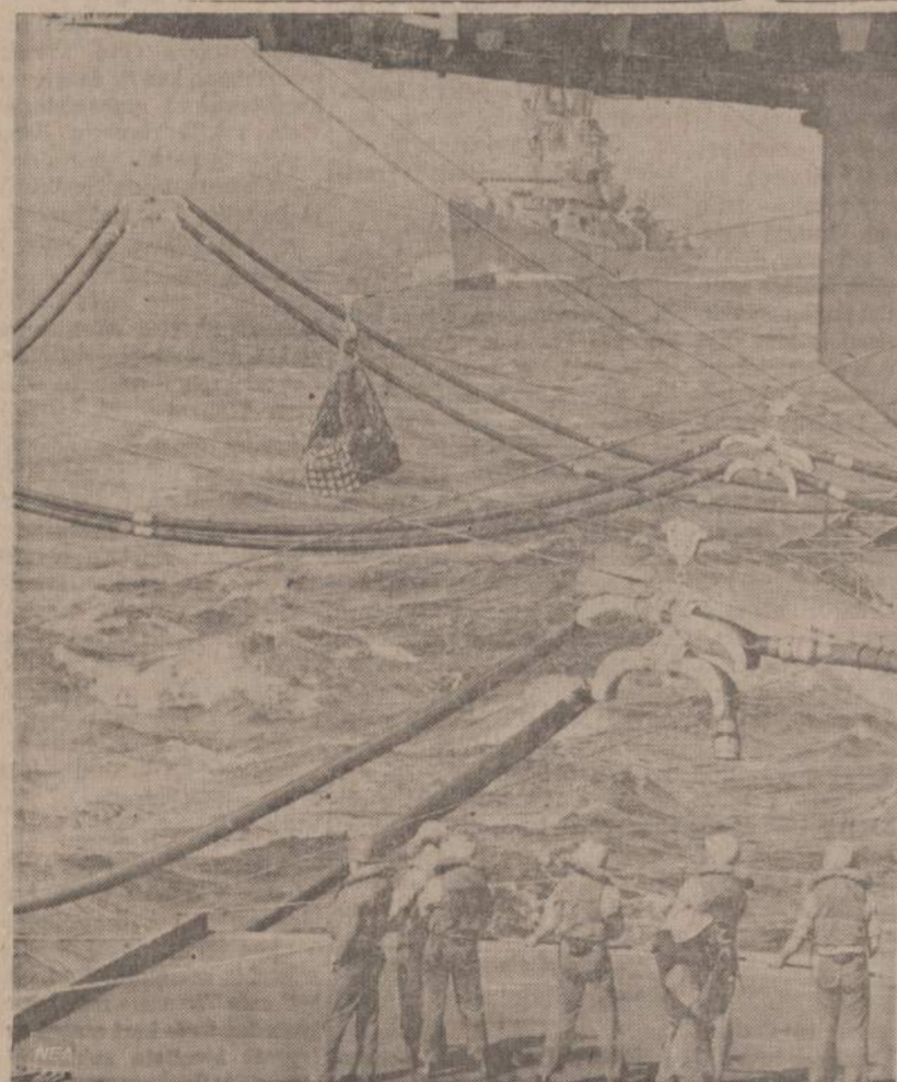
Amerikos karo laivai neramioje jūroje gauna reikalingo kuro ir kitos medžiagos. Panašiai laivai aprūpinami karo zonoje.

ALB Radijo klubas gavo visą valandą savo transliacijoms apie Lietuvą vasario 16 dieną 7-8 val. vakare, per WQRS-FM stotį, banga 105.1 mc. Tai ta pati stotis, kuri ALB programą transliuoja sekmadienį rytmečiais. Programos rengėjai prašo — ne tik amerikiečių publika paskatinti tas transliacijas išklausyti, bet ir patiems tų transliacijų nepamiršti.