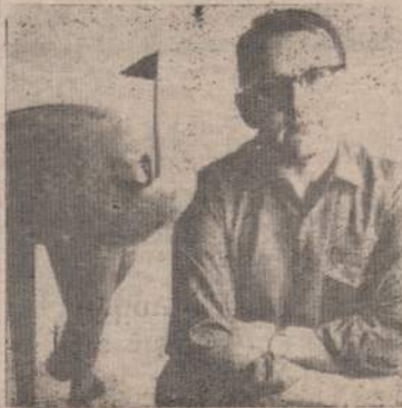
Skulptorius Petras Aleksa

Balzeko muziejus atdaras 7 dienas nuo 1:00 iki 4:30 v. p. p. Įėjimas nemokamas.