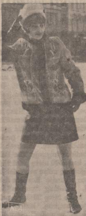
Londono moteriškų madų parodoje jugoslavė rodė pačią naujausią ir labiausiai jaunuolių mėgiamą madą. Trumpas jos sijonėlis yra odinis.

Anasai Ragučio stebuklas išgarsėjo visoje Palestinoje, o vėliau — visame krikščioniškame pasaulyje. Tačiau tik žemaičiai žinojo, kad tą stebuklą padarė dievaitis Ragutis.