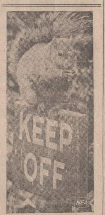
Iškaba liepia neįžengti, bet voverė nepkreipia dėmesio į isakymą. Ji užloko ant viršaus ir lukštena rasta riešuta.

Prieš 15 m. Nabisco pakrovimo — išsiuntimo biskvitu