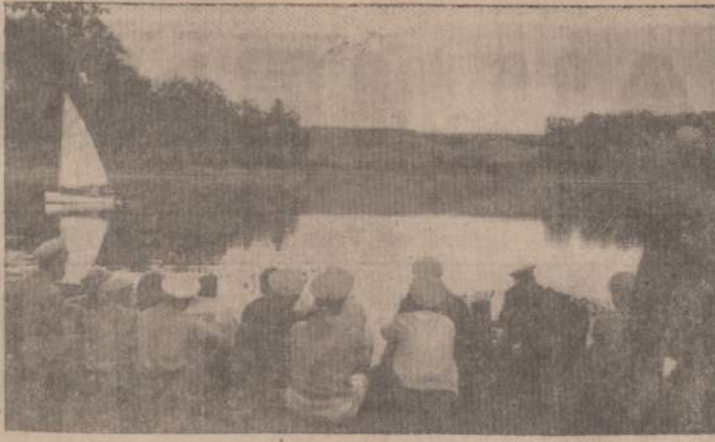
Jūry Skautijos vadovai stovykloje pasitarimo metu.

skautų buriavimo kursuose. Ruošėsi jaunimas ne "prie jūros", bet "į jūrą", kasdien tą jūrą vis labiau pamildamas ir užkariaudamas. Kasdien matydavom ateinančias ir išeinančias jachtas, girdėdavom skambias komandas, o vakarais, saulei leidžiantis, skambėdavo daina "Baltos burės plazda, bangos duokit kelią, pasakyk kur plauki, jūra motinėle..."