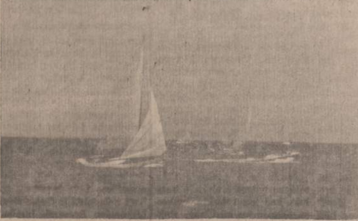
Jūry Skautijos burlaiviai ežero bangose.