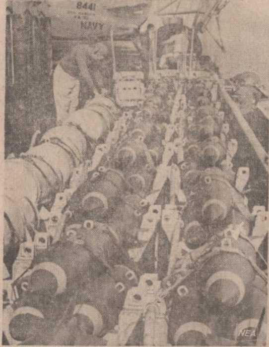
Jūrininkas tikrina Amerikos karo laive, plaukiojančiame Korėjoje pakraščiuose, esančias šovinių atsargas.

Jan Sangh yra nacionalistinė indų partija, prieš kurią kovoja ne viena kita partija. Jau girdisi gandai, kad partijos vadas buvo nužudytas musulmonų. Šitas gandas galėtų sukelti naujų kruvinių riaušių ir žudynių tarp indų ir musulmonų. Todėl vyriausybė kuo greičiausiai įsakė iširti Upadhayavos mirties aplinkybes.