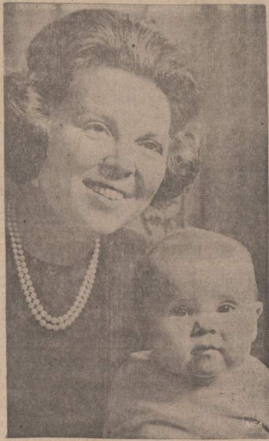
Olandijos princas Willem Alexander ir jo motina kunigaikštystė Beatrice. Balandžio 7 dieną princas minės savo pirmąjį gimtadienį.