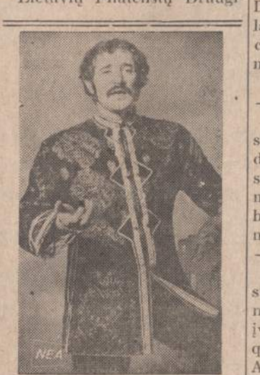
Artistas Richard Harris pasisūvo pavėlske matomą šilkinį švarką, kurį rengiasi nešioti net ir nevaldinimo metu.