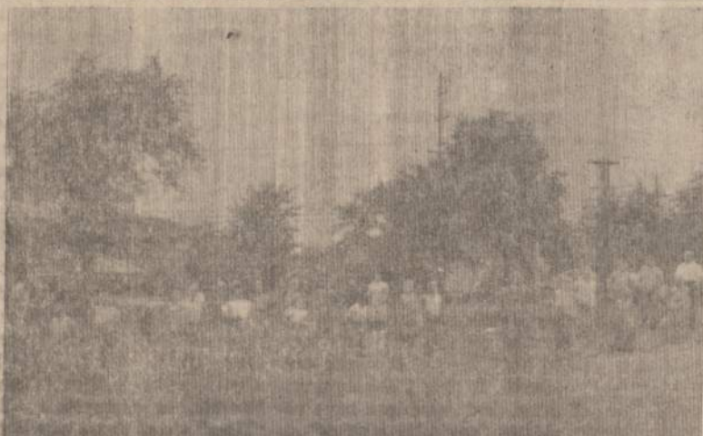
Naujienų išvykoje 1967 m. rudenį Alvudas sudaro vaikams jaukią aplinką dvasios ir kūno atsigalviniui.