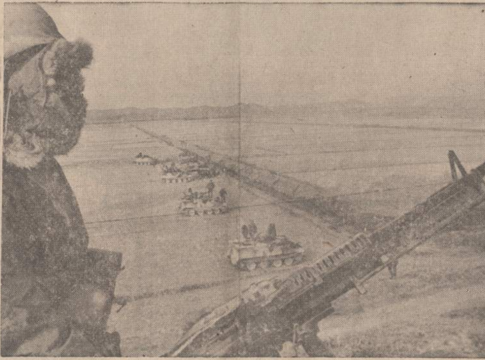
Panmunjon srityje eina JAV ir Šiaurės Korėjos komunistų pasitarimai dėl JAV laivo "Pueblo" ir jo igulos. Apačioje matome išsikišusius Jungtinių Tautų tankus, o viršuje sėdi karys prie kulkosvaizdžio.

LA PAZ. — Bolivijos prezidentas prisaikdino naują ministrų kabinetą. Senasis pasitraukė protestuodamas prieš susimanymą užmegzti diplomatinius ryšius su Sovietų Sąjunga.