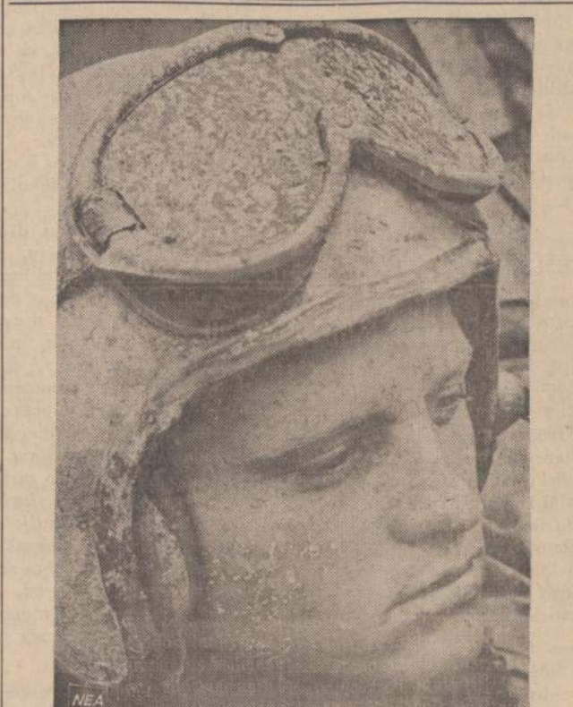
Amerikos tankistas, gerokai aptaškytas purvu, saugo Da Nango apylinkėse kelius, kad komunistai neužpultų pravažiuojančių karščių sunkvežimių su ginklais ir maistu.