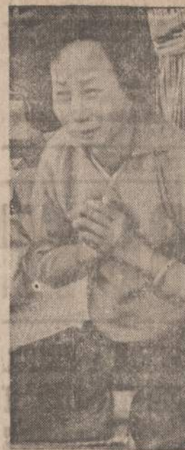
Seigono priemiestyje Cholono įsistiprino komunistai. Jie kovoja dėl kiekvieno namo. Cholono gyventojai buvo priversti apleisti savo namus. Pavyskle matome moteriškę netekusią savo namų.

Praėjusios metinės rinkliavos proga dar gautos Dariaus ir Girėno klubo 25 dol. ir S. Dambrauskienės 5 dol. aukos. Galutinai rinkliavos pajamų suma — 4,000 dol. Anksčiau paskelbtuose sąrašuose praleistas rinkėjas. Saudargas, o 5 dol. aukojusių tarpe tilpo rinkėjo pavardė vietoje aukotojo J. Ljaudansko; juos atsiprašome. Valdyba