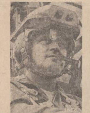
Helikopterį lakūnai turi naują priemonę prieš apšaudyti. Iki šio momento lakūnas, pastebėjęs priešą, turėdavo pranešti kitam kariui, kur yra priešas. Tas, suradęs priešą, paleisdavo kulkosvaizdį. Dabar lakūnui nereikia įsakinėti. Užtenka tiksliai pažūrėti į priešą, kad naujai pagamintas prietaisas šviesos spinduliais paleistų kulkosvaizdžio kulkas.

WASHINGTONAS. — Amerika taupumo sumetimais nutarė nedalyvauti 1969 metų Paryžiaus viacijios parodoje.