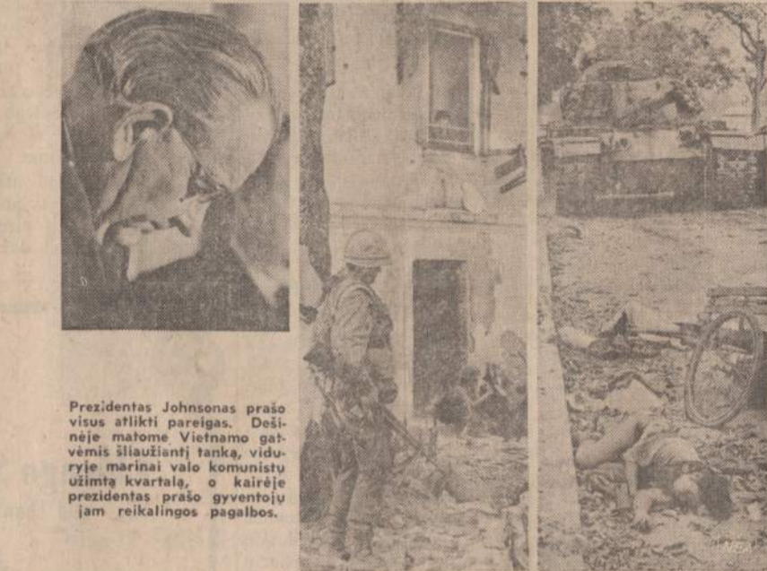
Prezidentas Johnsonas prašo visus atlikti pareigas. Dešinėje matome Vietnamo gatvės šiuoju metu, viduryje mariniai valo komunistų užimtą kvartalą, o kairėje prezidentas prašo gyventojų jam reikalingos pagalbos.