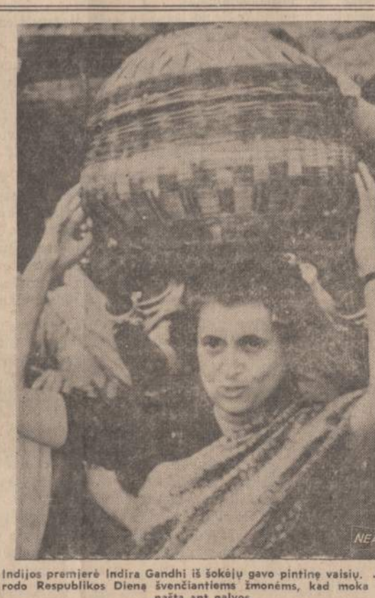
Indijos premierė Indira Gandhi iš šokėjų gavo pintinę vaisių. Ji parodo Respublikos Dieną švenčiantiems žmonėms, kad moka nešti našta ant galvos.

tikavo Pentagono civilius vadus, kurie blogai administruoja visą karą eiga. Vyriausybė turėtų daugiau klausyti karo vadų ir mažiau kištis į tą karą. Diplomatu kišimasis į karą, jiems patiems sėdint Vašingtone, privedė prie dabartinės padėties Vietname.