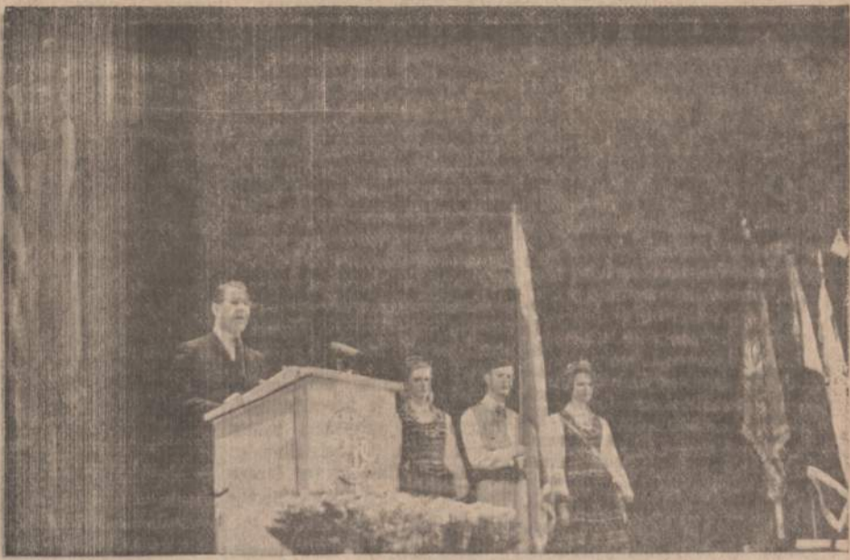
Senatorius Vance Hartke kalba šių metų vasario 18 dieną Čikagos Operos rūmuose Lietuvos Nepriklausomybės paskelbimo 50 metų sukakties minėjimui susirinkusiems lietuviams. Sen. Hartke pažadėjo ir atsitęje padėti lietuviams vesti kovą gimtiniam savo kraštui išlaisvinti.

direktorius J. Videika apie tai jam užsiminė. Ir dar vienas Eišiškių "bruožas": Pagal tai, kaip perkamos knygos, galima spręsti tik apie atskiro rajono kultūrinį, tiek ir ekonominį lygį. Respublikoje vienam gyventojui vidutiniškai per metus parduodama knygų už 1,78 rb. Vilniaus krašto rajonus apibūdinančių knygų pardavimo rodikliai labai nevienodi. Paimkim, pavyzdžiui, Eišiškes ir švenčionis. Jeigu Lietuvos kaime kiekvienas gyventojas per metus vidutiniškai įsigyja knygų už 1,30 rb.; tuo arpu Eišiškių rajone vienam gyventojui knygų nupirkama vos už 0,56 rb., ir rajonas šia prasme užima paskutinąją vietą." II. Sovietų Sąjungai minint komunistinio Rusijos įsigalėjimą (pernai suėjo 50 metų) atsiliepė ir rusų emigracija Vakaruose. Ypač pravartu žinoti "atsiūkėjimus į Rusijos inteligentus. Tikra minčių ir idėjų mišrainė. Girdi, komunistas nelaimė, bet... Vakarai turį ieškoti tūty į Rytus". Ypač "turi būti" taikos ir evoliucionavimo JAV, ir t. t. ir t. t. Beje, už taip sakant, komunistinio pasaulio "prijaukinimą" į taiką atsakingi visi inteligentai ir šiaip ir anapus geležinės uždangos. Atsišaukimas, be kitų, pasirašė G. Andrejev, red., V. Veidle, rašytojas, M. Veinbaum, redaktorius, Zaicev, rašytojas ir t. t. "Nowoje Russkoje Slovo"