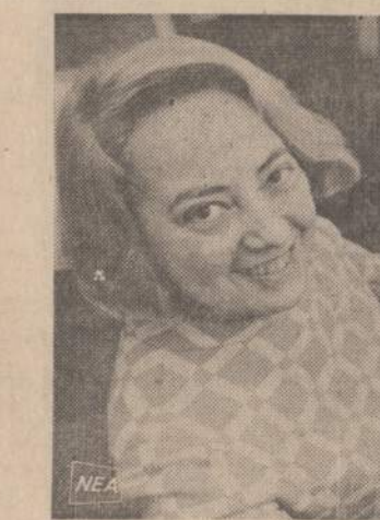
Muriel Siebert užmokėjo $445,000 už vieta New Yorko Stock Exchange. Ji yra pirmoji moteris, išrinkta 175 metų veikiančios New Yorko biržos viešon. Tvirtinama, kad ji yra gabi finansininkė ir sugeba rūpintis saugiais investicijomis.

— ALVUDO metinis narių susirinkimas yra šaukiamas š. m. kovo mėn. 2 dieną švenč. Mergelės Marijos parapijos salėje, 6812 S. Washtenaw Ave. 6:30 val. vakaro. Visi Alvudo