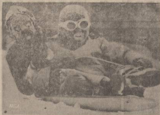
North Carolinai, Charlotte miestelyje, smarkiai prisigo. Du vaikai, gavę roguotes, apsimaskavę leidžiasi miestelio kalvomis, vaizduodami, kad jie iš kitų planetų įsibrauna į Žemės planetą.