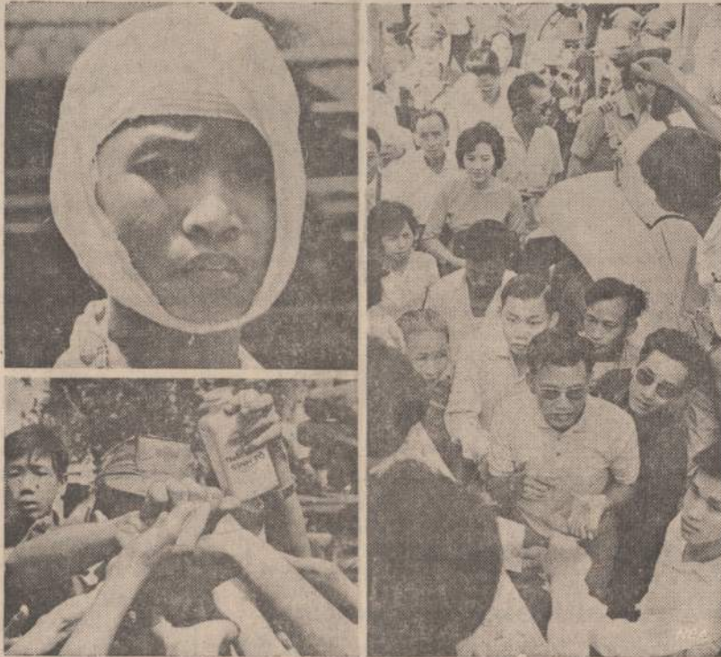
Šiandieninio Vietnamo sostinės vaizdas. Gyventojai bėga iš Saigono, bet sužeistieji skuba į Vietnamo sostinę, kad ligoninėse būtų suteikta pirmoji pagalba. Viršuje matome sužeistą ir pirmą pagalbą gavusį jaunuolį. Apačioje tos pačios ligoninės gydymo salone vaikams reikalingus vitaminus. Dešinėje Saigono gyventojų eilė laukia ryžių. Prasidėjus kovoms, mieste pritrūko ryžių ir kitokio maisto. Prie krautuvių ir sandėlių susidaro eilės žmonių.

Prezidentas Parkas pareiškė, kad jis šių dviejų organizacijų pavyzdį paėmė iš Izraelio civilinės gynybos organizacijos, nes padėtis ten yra panaši, kaip Korėjoje.