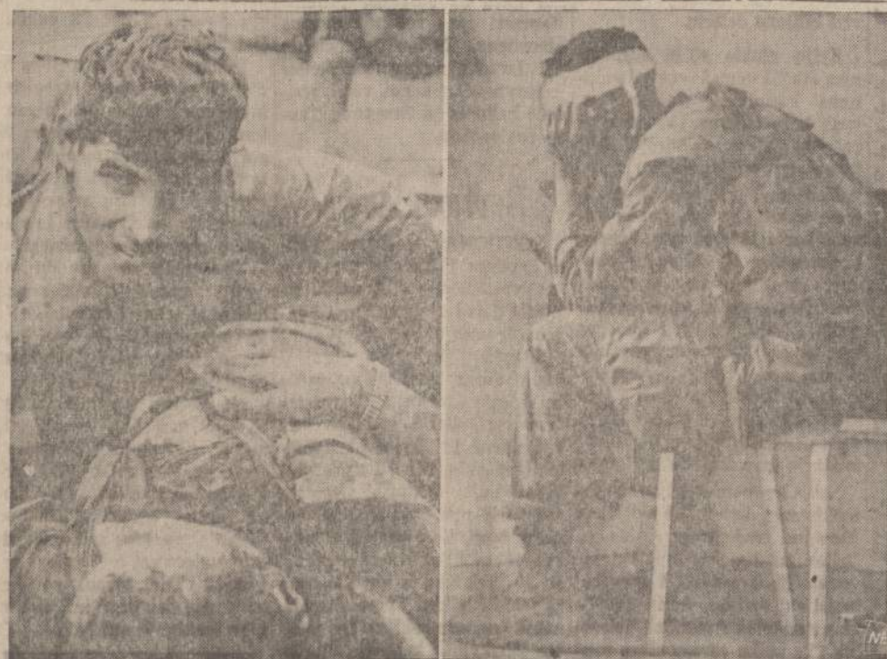
Pietų Vietname, Hue miesto centre, eina smarkios kovos tarp Amerikos marinių ir ten įsisiprinusių komunistų. Kairėje matome marinius, raminančius sužeistą draugą. Dešinėje sužeistas Amerikos karys sėdi name, iš kurio buvo išvyti komunistai.

1737 So. Halsted Street Chicago 8, Illinois