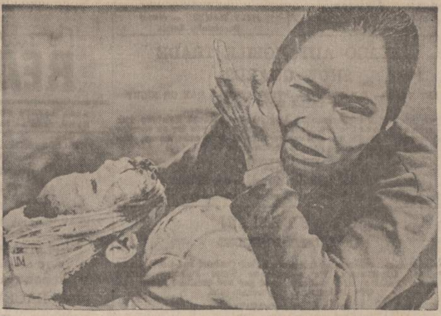
Komunistams įsiveržus į Hue miestą, visame mieste ėjo smarkios kovos. Artilerija ir aviacija su- groivė senamiestį, bet komunistai dar laikosi už senos 12 pėdų storio sienos. Hue miesto gyven- toja neša sužeistą savo vaiką į Amerikos marinių laikomą sritį, kad suteiktų sužeistajam pirmą- ją pagalbą.

DR. VYT. TAURAS GYDYTOJAS IR CHIRURGAS Bendra praktika, spec. MOTERŲ liguos Ofisas: 2652 WEST 59th STREET Tel.: PR 8-1223 OFISO VAL.: pirmadi., antradi., trečiadi., ir penktadi. 2-4 ir 6-8 val. vak. Seštadie- nias 2-4 val. po pietų ir kitu laiku pagal susitarimą.