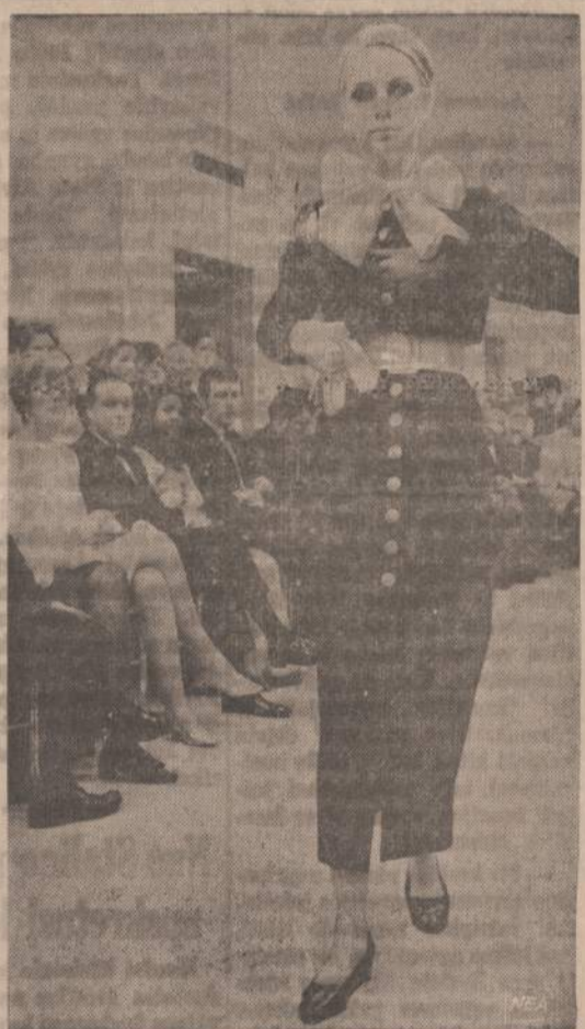
Amerikos moterims paruoštas pavasarinis apdaras. New Yorko ponios apžiūrinėja modelį.