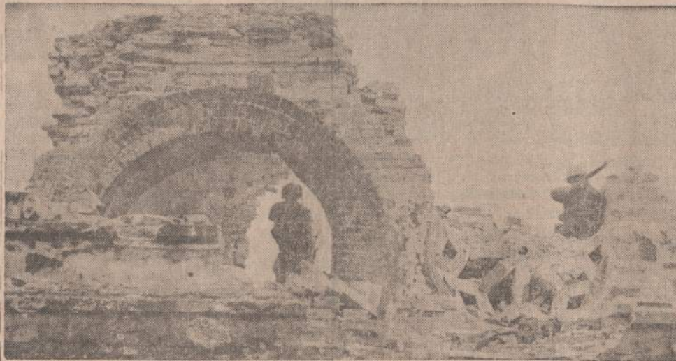
Hue mieste, senoje Vietnamo sostinėje, eina pačios smarkiausios kovos su komunistais. Priešui pavyko įsistiprinti senoje pilyje. Amerikos aviacija gerokai pili apgriovė, bet priešų dar neišnaikino. Paveikste matome Amerikos marinus, užimančius naujas pozicijas apgriautoje pilyje.

St. Baro solo koncertas (akp. A. Kepalaitė) iškilme išpuošė pasigėrėjimu ir pasididžiavimu — taip Lietuva dainuoja, net ir iš tėvynės ištumtoji. (E)