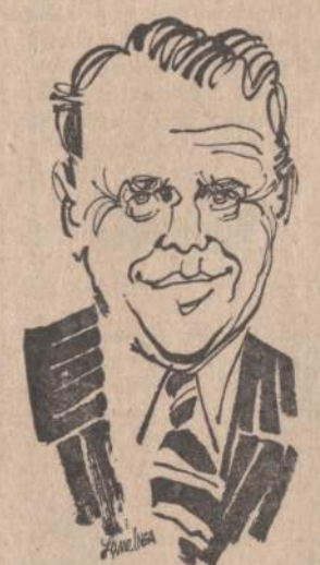
Clark M. Clifford

Malto vidaus politika ateityje gali pakrypti Maskvos kryptimi, nes čia, pasitraukus britų karo laivynui, padidėjo bedarbių skaičius. Darbo unijų vadas Dom Mintoff seniai rodo palankumą Kremlui. Jei jam pavyktų atsistoti valdžios priekyje, je ir pašalinti galinga katalikų bažnyčios įtaka, sovietų viltys galėtų išsipildyti ir viena stipriausių Viduržemio jūros tvirtovių galėtų atitekti sovietams.