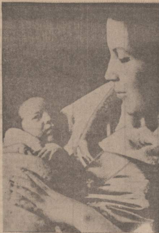
Himalajų kalnuose esančios Sikimo valstybės karalienė Mopo Namgyal pagimdė dukrą. Pirmasis jos kūdikis buvo karalaitis Palden, būsimas Sikimo valdytojas. Dabar Sikima valdo karalaitis Palden Namgyal. Naujai gimusi dukra sveika ir stipri.

Žmona išmetinėja vyrui: — Žinau viską. Policininkas rado tavo ketvirtą valandą ryto apsikabinusį stulpą. — Tik jau, mieloji, nepavydėk stulpui!