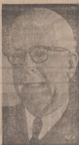
Valstybės išdo sekretorius Henry H. Fowler aiškina atstovų rūmų finansų komiteto nariams, kad būtina reikia priimti prezidento prašytą mokesčių įstatymą. Krašio ūkiui gresia infliacijos pavojus, išgu kongresas nesims apsaugos priemonių.

★ Tradicinis Čikagos Lietuvių jūrų skautijos balius Puota Jūros Dugne, šiais metais įvyks per Atvelykį — balandžio mėn. 20 d. Western Ballroom salėje. Jau pradėti pasiruošiamieji darbai.