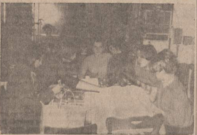
LJS Juodkrantės tunto Medužių valtis darbo sueigos metu.

Šia proga sveikinami pakeltieji ir linkima jiems Gero Vėjo tolimesnio jūrinio skautavimo ir jauniesiems vadovavimo kelyje. LJS Inkaro Taryba