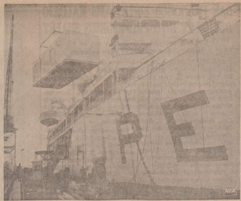
Amerikos laivai Hepe įkeliama visa klasė, kurioje profesionalai ir gydytojai galės mokytis slaugos, kaip suteikti pirmąją pagalbą. Įkeliama 12x36 pėdų kambaryje yra visi moderniausi įrenginiai. Panašiai pastatyti vienetai vartojami prie didesnių Amerikos mokyklų. Laivas plauks į Ceiloną, kur amerikiečiai apmokys jaunus slauges.