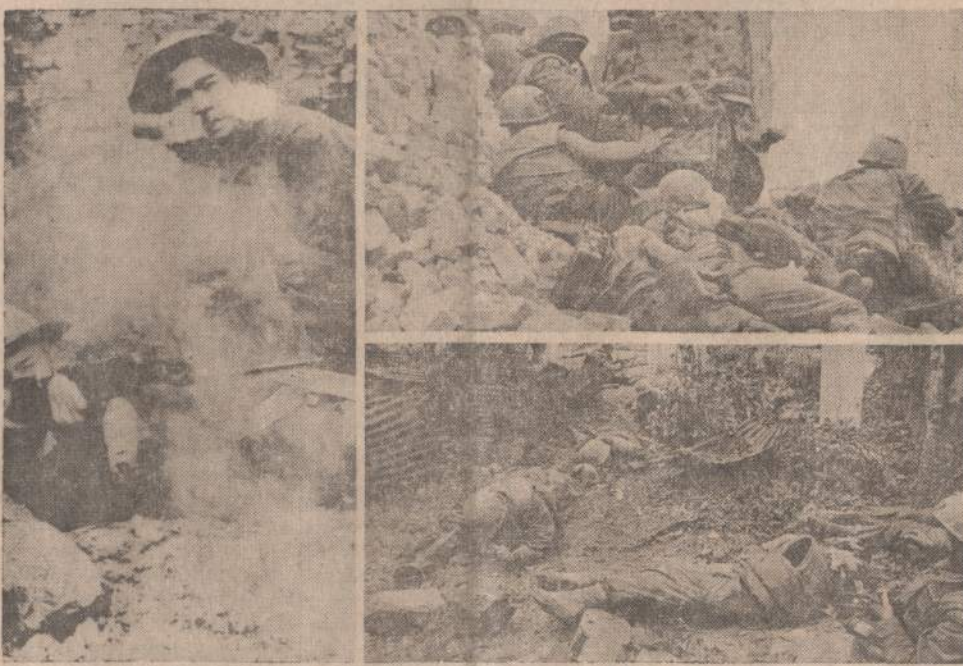
Tris savaites tęsėsi kovos Hue mieste centre ir tvirtovėje, bet šeštadienį Amerikos mariniai ir Pietų Vietnamo kariniai visiškai palaužė komunistų pasipriešinimą. Komunistai bandė atsistai sustiprinimu, bet nepajėgė. Likusieji pasidavė nelaisvėn. Kairėje matoma sargybas einančius komunistus, o dešinėje Amerikos mariniai nori apsisuogoti nuo priešų kulku.

SIDNEJUS. — Australija prieš du metus įsivedė naują pinigų sistemą — dolerius. Dabar rūpestį kelia 50 centų monetos dingimas iš apyvartos. Ši moneta turi 80% sidabro, todėl žmonės ją renka. Ypač, kad sidabro kainai pakilus, už monetą galima gauti net 57 centus.