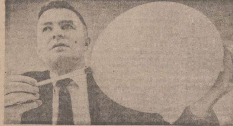
Minnesotos vieškelių policija jau aprūpinta paveikslė matomu ballenu, kuris policininkui padeda nustatyti, ar automobilistas yra girtas ir kiek jis nusigėręs. Bliuivybei matuoti prietaisas bus naujingas, jeigu automobilistas panorės jį įspūsti savo kvapą.