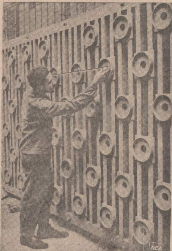
Pirmoji čekų atomo energijos dirbtuvė, baigiama statyti Pragoje. Čekai giriasi, kad atomo energija bus naudojama tiksliai pramonės tikslams.

SKAITYK "NAUJIENAS" — JOS TEIKIA GERIAUSIAS, TEISINGIAUSIAS PNTIAS