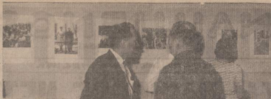
LANKYTOJAI GERIMANTO PENIKO FOTO DARBU PARODOJE

Vasario 24 d. Chicagoje pasibaigė Gerimanto Peniko foto darbų paroda, vaizdavusi Akademikų skautų gyvenimą ir vykusį nuo vasario 4 d.