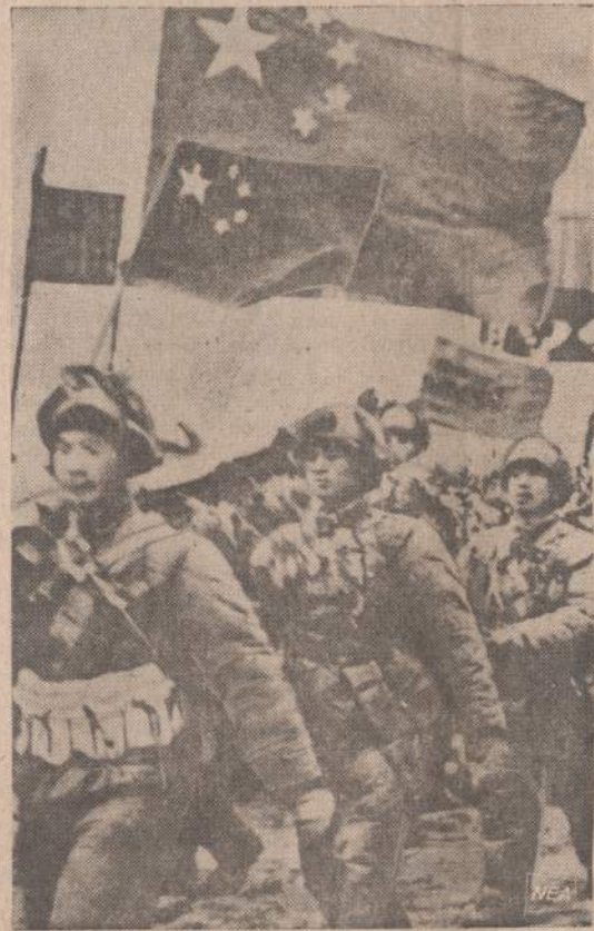
Korėjoje padidėjus įtempimui, Kinijos komunistai prisiminė praėjusį Korėjos karą ir jame dalyvavusią Kinijos Liaudies savanorių kariuomenę. Nuotraukoje, kuria paskelbė Pekino vyriausybė, matome Kinijos „savanorius“, lygiuojančius su vėliavomis į karą Korėjoje. Oficialūs kinų užrašai sako, kad kartu su Korėjos liaudimi jie kariai sudavė Amerikos agresoriams mirtiną smūgį.

Turkų vyriausybė veda politiką, kuri siekia draugystės su visais. Pagerėjo santykiai ir su komunistinėmis valstybėmis, net su Sovietų Sąjunga. Amerika neparėmė Turkijos prieš Gra-