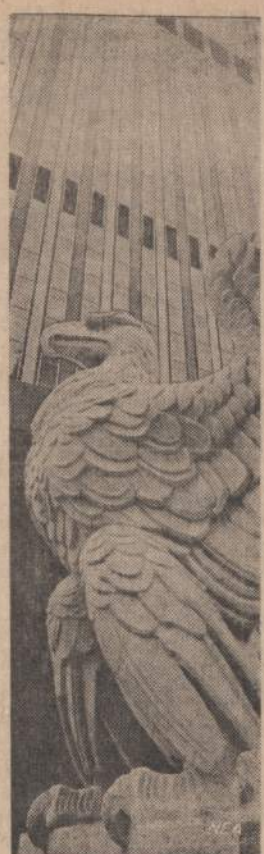
New Yorke Madison Square Garden naujus didelius namus dabar puošia paveikslas matomas aras. Nuo 1904 metų jis saugojo New Yorke — Penningtonijos stotį. Dabar sena stotį jau nugriauta, o buvę arai nutūpę prie naujų namų.

— Nepriklausomybė yra idealas, tačiau kartais ir laisvė gali reikėti tautai mirtį. Svarbu, kaip susiorientuosime dabartinėje situacijoje. Dėl tautos nereikia verkti, reikia ką nors daryti esamose sąlygose. Lietuvoje įvyko dideli pasikeitimai, juos reikia vertinti istorinėje perspektyvoje. Rei-