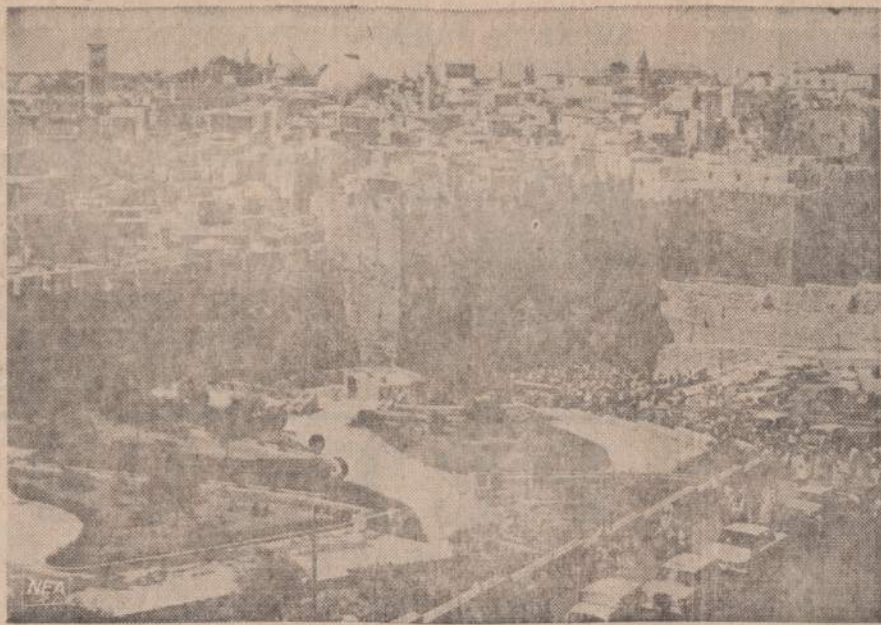
Arabu laikyta, bet praeitis metais žydu užimta Jeruzalė ateinančia vasara laukia daug turistų. Kanadoje, Amerikoje ir kituose kraštuose gyvenantieji žydai organizuoja ekskursijas į Jeruzalę. Kiekvienas žydas nori pamatyti Verksmo ir Škausmo sieną, stovinčią nuo karaliaus Salomono laikų. Jeruzalėje yra daug mahometonų, katalikų, stačiatikių ir kitų tikėjimų šventyklių.