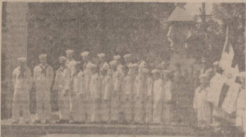
PRIE LAISVĖS PAMINKLO JAUNIMO CENTRO SODNELYJE Chicago jūrų skautų LK Algimanto laivas su savo vėliava.