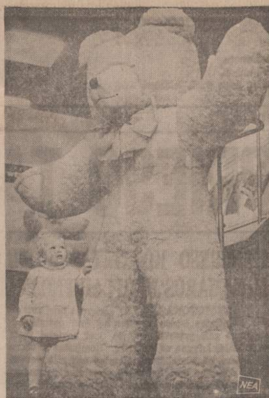
Anglijoje ruošiamoje parodoje išstatytas toks didelis meškinas, kad prie jo priėjusi mergytė stebisi.

(Iš siemetinės Australijos rajono "Džiugo" tunto vasaros stovyklos, įvykusios sausio 3-13 Viktorijos vietovėje, Mt. Martha kalvoje).