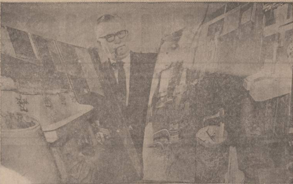
Susiorganizavus New Yorko garai liuvių prižiūrėtojus į unitą, josios prezidentas grasina streiku, jeigu nebūs padaryta pagerinimų. Paveiksliai rodo New Yorko garuose esančią nešvarą.

Čia bus vietoje priminti katalikų tikėjimo sklindantį gaudą, kaip vienas lietuviškos parapijos klebonas pasakė, girdi, pašalinus iš šv. Kazimiero kapinių