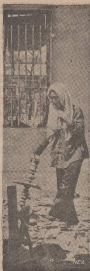
Komunistams įsiveržus į Saigoną, iš- griauta daug namų ir šventovių. Ko- munistai buvo įsistiprinę Cholone priemiestyje buvusiose budistų mal- dyklėse. Paveikslė matoma moteris renka fosfos namuose buvusio ir ka- ro veiksmų metu sudaužyto altorėlio liekanas.

Po pertraukos nurodė meninė programa. Šeštadieninės mo- kyklos vaikučiai, vadovaujami