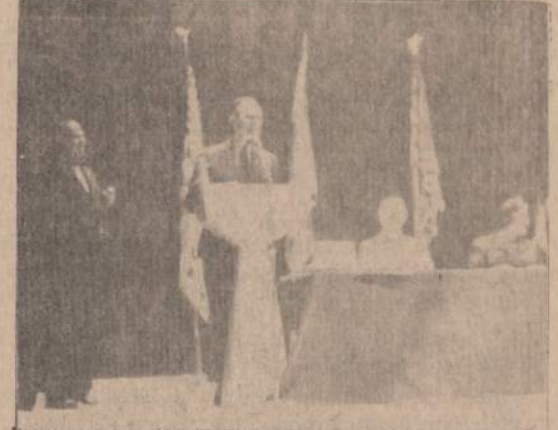
Lietuvos Nepriklausomybės Atkūrimo 50 metų sukakties minėjime Detroito kalba JAV senatorius P. Hart.