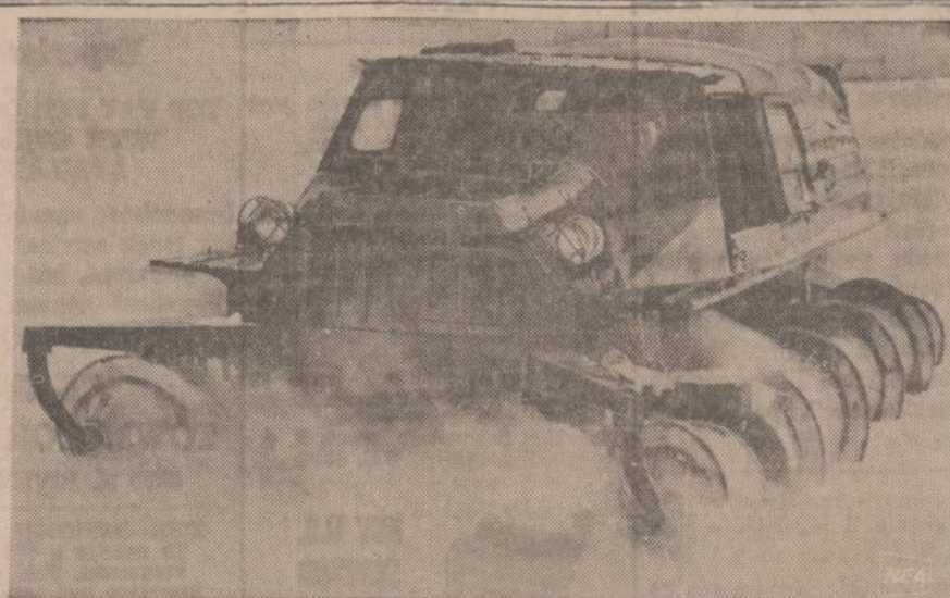
Naujausioji sovietų karo mašina, tinkanti visiems keliams. Ji važiuoja sausumos keliais, vandeniu, purvu ir sniegu. Vietoj vikšrų, ši mašina turi besisukancius gražtus, kurie gana lengvai stumia mašiną pirmyn sniegu ir purvu.

7909 STATE RD. OAK LAWN, ILL. Phone: 636-2320