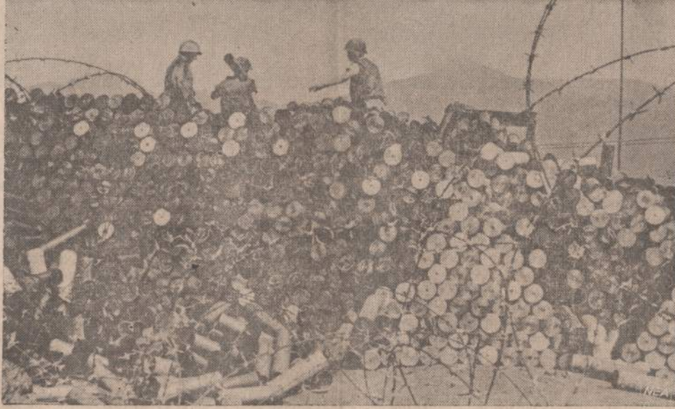
Khe Sanh srityje Amerikos kariai krauna į krūvas iššautu artilerijos šoviniais tūtais. Komunistai, įsistiprinę aplinkinėse kalvose, apšaudo Khe Sanh bazėje esančius Amerikos marinius.

Taip pat Šveicarijos politikos departamentas padėjo ant velionies karsto vainiką, o departamentui laidotu vėse atstovavęs ambasadoriaus rango virsšininkas apibūdino velionį kaip stropų ir pavyzdiną valdininką. Velionius retos išimties tvarka buvo suteiktos pilnutinio valdininko teisės, nežinint, kad jis jau buvo gerokai peržengęs nustatytą tokiomis atvejais amžiaus ribą.