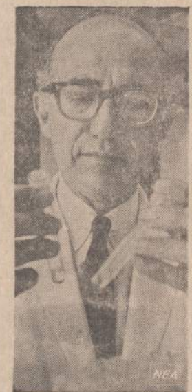
Dr. Jonas Salk išrado skiepus prieš paraližę, šiandien jie plačiai vartojami visame pasaulyje. Dabar Dr. Salk nori perorganizuoti visa mokslinių tyrinėjimų sritį. Jam atrodo, kad prie mokslinių tyrinėjimų būtina reikią pridėti humanizmą. Jis pradėjo studijuoti filosofiją ir labai dažnai vartoja žodį biofilosofija. Kovo 3 d. televizijos reporteriai turės progos šį mokslininką apklausti.

Komiteto nuomone, šių metų tautinių šokių šventė bus vienas reikšmingiausių Amerikos lietuvių plačiai minimų jubiliejinių Nepriklausomybės sukakties metų įvykių, kuriame bus ypatingai pabrėžiamas išėjusių lietuvių jaunimo pasiaukojimas ir darbas savitai kultūrai išlaikyti.