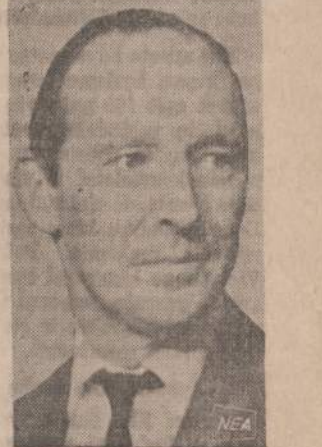
New Yorko ir britų spauda skleidžia žinias, kad pavėlėle matomas britų lordas Harlech, buvęs britų ambasadorius Washingtono, rengiasi vesti ponius Jacqueline Kennedy. Nužudyto prezidento žmona tvirtina, kad tokiems gandams nėra jokio pagrindo.