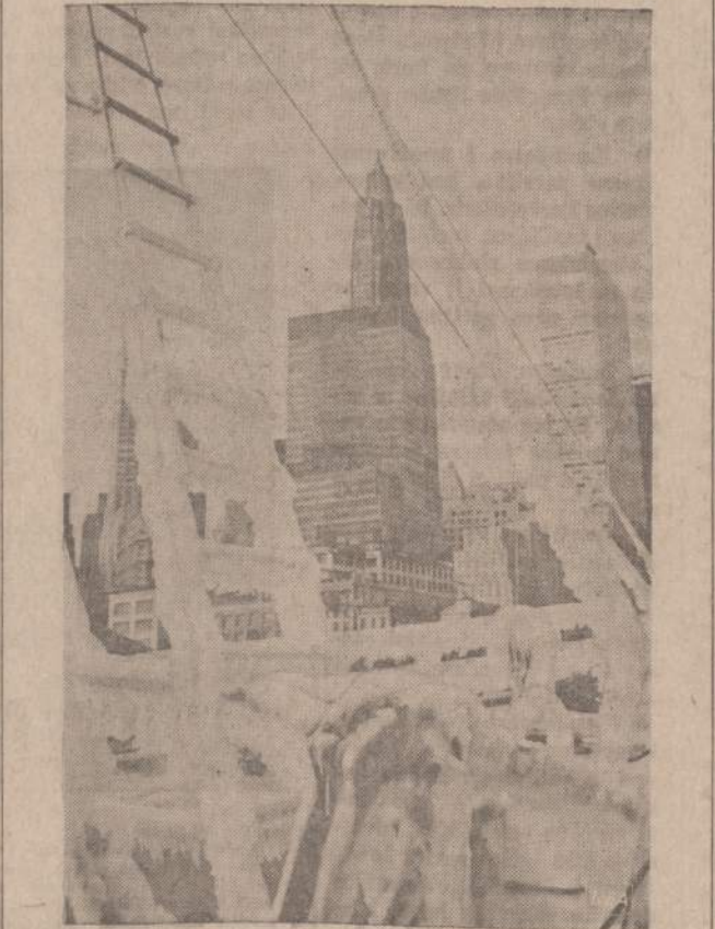
Salciams gerokai paspaudus, New Yorko uoste judėjimas sulėtėjo. Paveiksle matome New Yorko uosto žuvų rinką. Laivai apidodę, sunku priieiti prie žuvų.