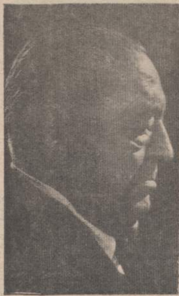
Architektas Ludwig van der Rohe

Tarpe balandžio ir birželio 30 d. Chicagos Meno institute vyks pilna apžvalginė garsiojo architekto Ludwig Mies van der Rohe architektūros nuotraukų bei planų paroda. Mies van der Rohe yra vienas iš garsiųjų 20-to šimtmečio architektų. Jis, Le Corbusier (šveicaras) ir Frank Lloyd Wright transformavo