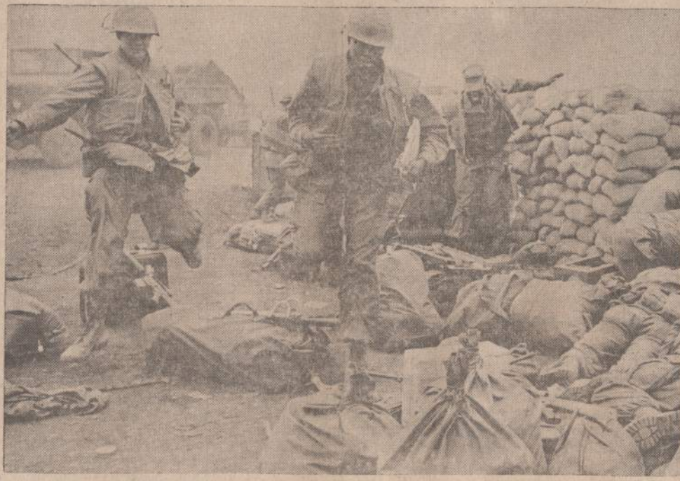
Khe Sanh tvirtovėje kasdieninis karių gyvenimo vaizdas. Atskirde malūnsparnai iškrauna maistą ir šovinius, o vėliaus paskubomis paims sužeistuosius ir jų daiktus.

Civilinis Jemeno karas prasidėjo 1962 metais, kada Abdulah al Salal nuvertė nuo sosto Imamą Mohammadą al Badri. Šio šalininkai, kurie jį laikė ne tik pasauliniu, bet ir religiniu vadu, griebėsi ginklo.