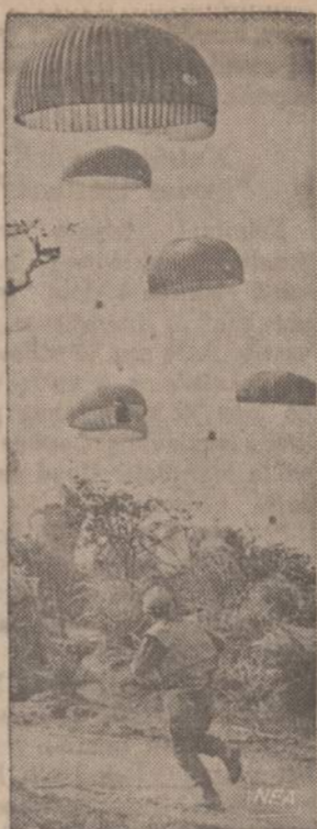
Didieji Amerikos lėktuvai paraišutais išmeta maistą ir karo medžiagą Khe Sanh srityje apsupiems Amerikos mariniams. Kariai skuba paimti paraišutais nuleistus siuntinius