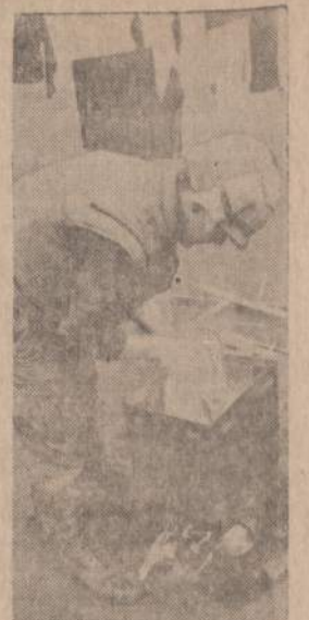
Khe Sanh srityje mariniai turi rūpintis svara ir higiena. Paveiksle matome mariną, plaukiantį savo baltiniais.

Reikalas įgavo per daug rimtą formą, todėl plačiau apie tai teks pasisakyti sekantį kartą.