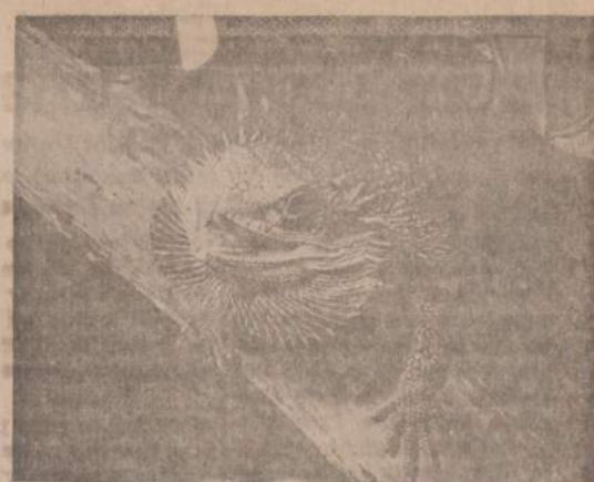
BARZDOTAS SLIBINAS AMPHIBOLURUS BARBATUS

MASKVA. — Sulaukusi 86 metų mirė sovietų čekistų viršininko Felikso Dzeržickio našlė. Ji jaunystėje dirbo kominternu centre.