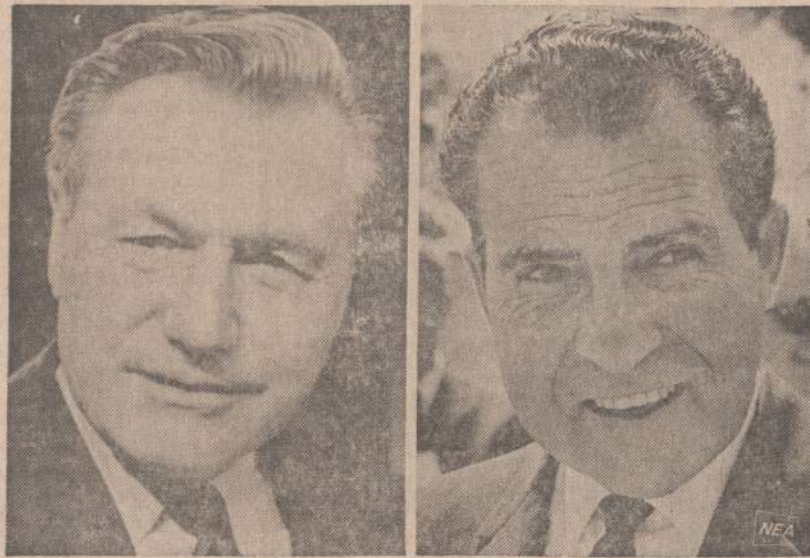
Michigan gubernatoriui atsisakius kandidatuoti į prezidentus, lieka tikslai du respublikonų partijos kandidatai: New Yorko gubernatorius Nelson Rockefeller (kairė) ir buvęs viceprezidentas Richard M. Nixon. Rockefelleris sutiko kandidatuoti, jeigu partijos konvencija jį pasirinktų. Richard Nixon nori, kad Rockefelleris ryžtųsi mėtis į pirminius rinkimus bet kurioje valstijoje.

PREORIA. — Pietų Afrika greitai vėl teis aštuonis juodus teroristus, kurie buvo atsiųsti iš kitų kraštų su ginklais.