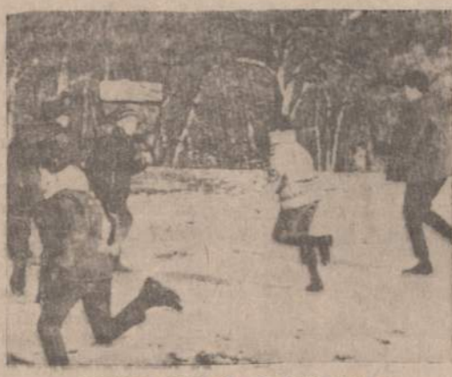
BAIGIASI ZIEMA IR JOS MALONUMAI iš sniego kautynių iškyloje.