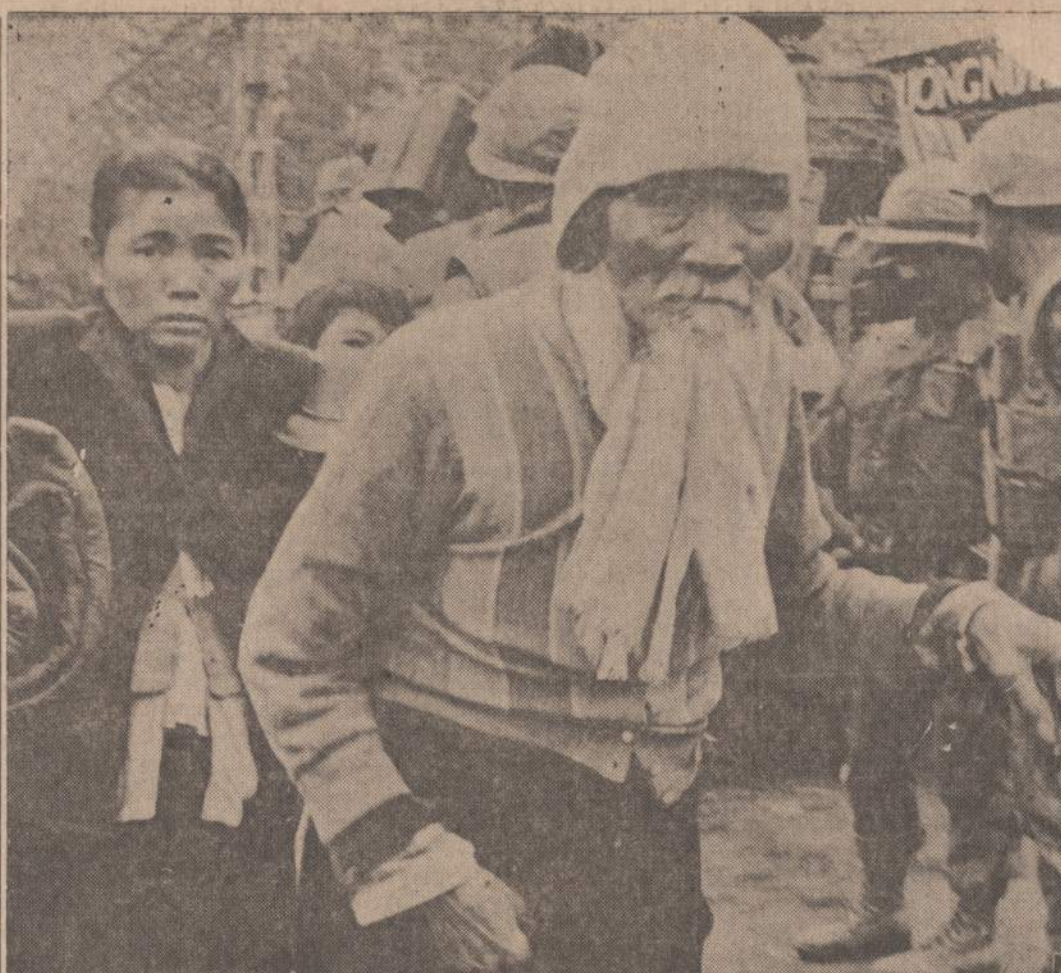
Komunistams pavyko užimti Hue miestelį ir išnaikinti visus miestelio policininkus bei savivaldybės tarnautojus. Likusiems gyventojams buvo leista išvykti iš miestelio. Paveiksle matome senus ir jaunus, žingsniuojančius iš miestelio zonos. Kovos metu sugriauta 50,000 gyvenamųjų namų. Hue mieste komunistai norėjo sudaryti savo valdžią, bet jiems nepavyko. Amerikos mariniai ir Vietnamo kariai komunistus išnaikino. Nedideliam komunistų skaičiui pavyko išsigelbėti.

Respublikonai, jų vadai žino, kad V. Adamkus yra populiarus, jaunas vyras, plačiai dalyvaujas lietuvių visuomeniniame gyvenime jau daug metų. Jie susidomėję stebės, kokį balsuotojų bloką lietuviams pavyks suorganizuoti. Tą visą klausimą atidžiai seks ir demokratų partija. Jei lietuvių išrinktų savo žmogų, nepaisydami partinių pasiskirstymų, labai galimas daktas, kad ateityje ir demokratai paieškotų lietuvių tarpe tinkamo kandidato kuriai nors svarbiai vietai.