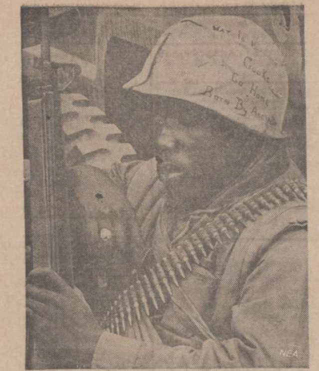
Is išvaizdos matyti, kad šis Amerikos karys Vietname yra gerokai išvargęs, bet is rankų neišleidžia šautuvo, nes ne viena kartą prieš yra užpuoles is pasaly.

Svarbiausios jėgos karui prieš komunizmą Azijoje turėtų būti iš pačių aziatų. Jungtinės Valstybės turėtų jų pastangas paremti kaip draugas. Korėjoje ir Vietname amerikiečiai nešė naštos dalį didesnę negu aziatai. Tai nelikš. Jos (JAV) turėtų tik padėti