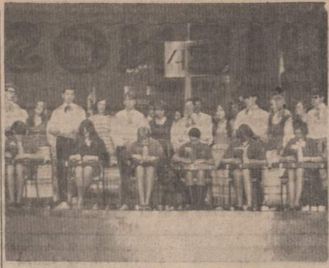
KANKLININKIŲ BURELIS IR TAUTINIŲ ŠOKIŲ GRUPĖ TORONTE, šimomi savųjų ir sveimųjų tarpe. Kanklininkės sudaro "Šatrijos" tunto skautės, o šokių grupė — jūrų skautai ir skautės.

Reikalai geri: atrodo, kad Ramiojo Vandenyno pakrančių skautai-ės tautinėn suskris labai gausiai. Proga vykty yra dviguba: tuo pačiu laiku jie „šauņa du zukių“: III-ją Tau-