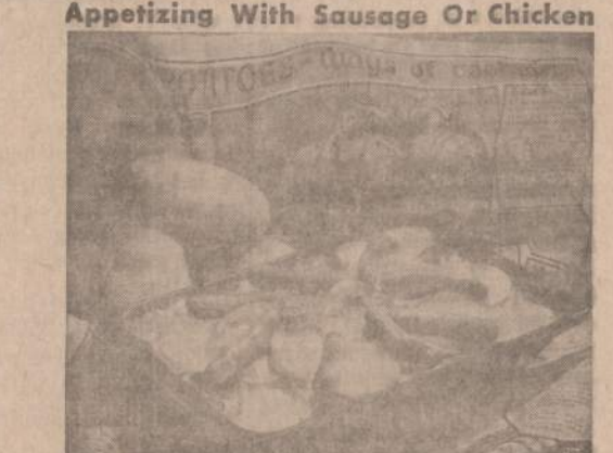
You'll treasure this new recipe for creamy scalloped potatoes because it's so versatile you can serve it with sausage, chicken, spareribs or beef. Delicious with hamburgers, too, and especially tempting now when those farm-fresh, newly harvested Russet potatoes from Washington State are plentiful at your nearby supermarket. Washington growers say it's their mineral-rich lava soil that gives these choice Russets their extra-special flavor and valuable energy-building nutrients so you'll want to serve them often while they're available. Russets are all-purpose so you can use them in all your favorite cooked ways and in salads.

CREAMY, SCALLOPED POTATO CASSEROLE with Sausage 4 to 5 large Washington Russet potatoes 1 tsp. salt 1 small onion 1/4 tsp. pepper 1/2 cup melted butter or margarine 1 lb. link pork sausage 1/4 cups cottage cheese 1 egg 1 cup commercial sour cream Peel potatoes and slice thinly into rounds. Butter 2-quart shallow baking dish. Remove skin from onion and grate into melted butter. Add cottage cheese and blend. Cook sausage over low heat until lightly browned. In baking dish, alternate sliced potatoes, a layer of cottage cheese mixture, cooked sausage. Sprinkle with salt and pepper until potatoes are used. (Remove a few sausages for garnish, if desired.) Beat egg and blend into sour cream and pour over top of casserole. Bake in moderate oven (350°F) 30 to 60 minutes or until egg mixture is set and lightly browned and potatoes test done with a fork. Serve immediately. Garnish, if desired with sausage, parsley and tomato wedges. Makes 6 to 8 servings.