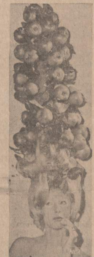
Italijoje moterys naujaisiais savo šukuosenas papuošia skaniais obuoliais. Ši šukuosena vadinasi levos šukuosena. Ieva vienu obuoliu prisivilgo Adoma, o šių dienų levoms reikia daugiau obuolių.

"Kodėl tokiems kirėiams vartoti naujus kamuoliukus? paklausė antrasis. Tokiems kirėiams pakaktų pavartotų". "Kad pavartotų aš neturiu", pasiaiškino pirmasis.