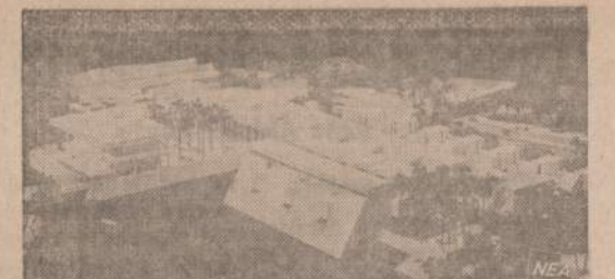
Be pramonės gaminių, parodoje kiekviena pietu Amerikos valstybė turės parodyti savo mokyklas, vadovėlius ir kitokias mokymo priemones. Taip atrodys vienas pietu Amerikos valstybių užimtą Interamos plotas.

"NAUJIENOS" KIEKVIENO DARBO ŽMOGAUS DRAUGAS IR BIČIULIS