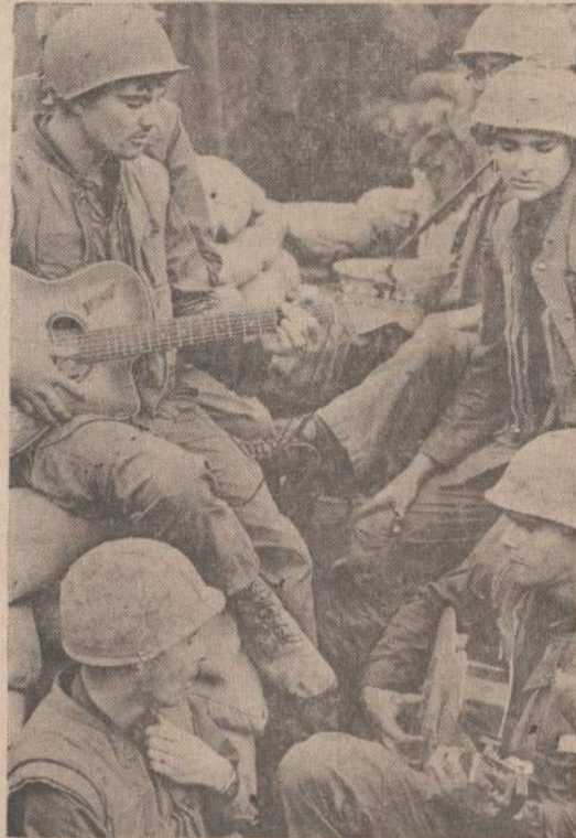
JAV marinai poilsio metu sulenda į Khe Sanh apžvalgos, išsisi, šnekučiuoja ir klausosi virpančios gitaros. Komunistai, atvilkę artileriją ir mortarus į aplinkines kalvas, nuolat apšaudo visa Khe Sanh sritį. Ypačingai jie sėka aerodromą ir apšaudo atsikreinančius ir išskrendančius lėktuvus ir malūnsparnius.

Parlamento ginčai prasidėjo, kai Ceylonas pareikalavo, kad ta sala būtų pripažinta Ceylonui, nes iš jo vykstanti kontrobanda ir nelegali indų imigracija į Ceyloną. Indijos vyriausybė net nežinojo tos salės vardo, nes ne visi žemėlapiai ją rodo. Kai kurie atstovai kaltina vyriausybę, kad ji nesaugo savo teritorijos žemių. Panašūs debatai parlamente kilo, kai tarptautinė komisija pripažino dalį Indijos valdomos Rann of Kutch teritorijos Pakistanui.