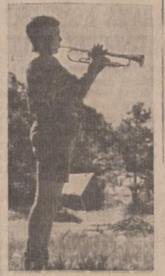
TAUTINĖS STOVYKLOS ŠAUKLYS

Iš visų vietovių gauti skydai bus sujungti į vieną junginį, kuris sudarys Brolijos Medį. Jis simbolizuos mūsų Brolijos vieningumą ir taip pat bus įdomus