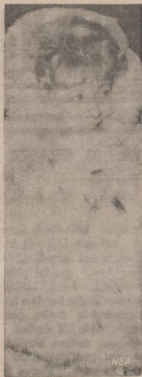
Artistė Lucille Ball, atvykusi į Saule Londoną, turėjo gerokai įsisupti kailius, kad nesušaltų.