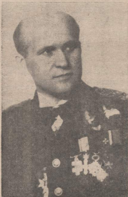
Aviac. gen. inž. A. GUSTAITIS

Antanas Gustaitis, sūnus Kazio, gimė 1898 m. kovo 27 d. Obelinės kaime, Sasnavos valsč., Marijampolės apskr. Taigi ši mėnesį sukanka 70 metų nuo jo gimimo.